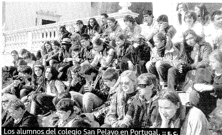
Los alumnos del colegio San Pelayo en Portugal.

5 días, en los que llevaron a cabo diversas visitas entre las que destaca la del Centro Portugués de Antidopaje. Allí conocieron al medalla de oro en las Olimpiadas de Pekín de triple salto, Nelson Evora. También presentaron el trabajo realizado por el colegio que consistía en una serie de dibujos sobre el dopaje. Los dos mejores trabajos de cada país se recogerán en un documento que se presentará en las Olimpiadas de Londres 2012.