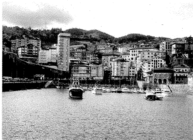
Vista del puerto con embarcaciones de recreo. ** GORRITIBEREA

pos favorables manifestaron que éste es un primer impulso para desarrollar posteriormente los cuatro campos de trabajo que son el desarrollo de la acuicultura, el impulso a la pesca artesanal, la unión de las posibilidades que ofrece el mar y sus productos y el desarrollo del turismo de mar.