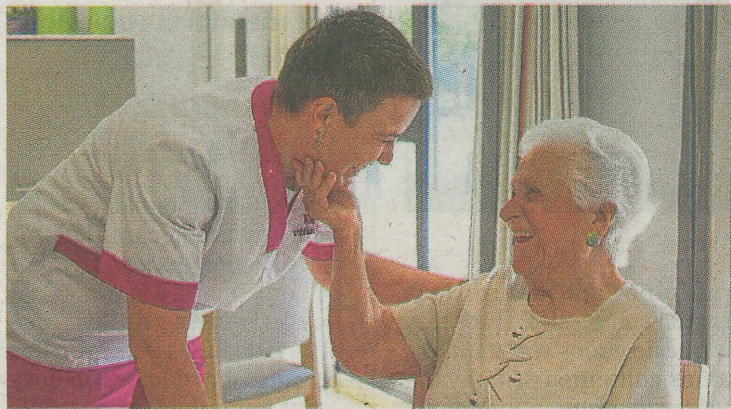
Personas usuarias de Abeletxe atenderán el mercadillo.