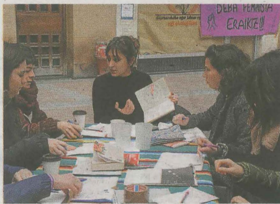
Por la mañana se organizaron talleres de diferentes temáticas. SALEGI

DEBA. El 8 de marzo, Día Internacional de la Mujer, comenzó con una pequeña kalejira que animó a más de uno a salir a la calle y a participar en los diferentes talleres organizados por Debako Talde Feminista. En el frontón Aldats se reunieron 15 parejas para participar en el campeonato de pala de partidas rápidas organizado Iruleak Emakume Pilotariak. En la Plaza Vieja se realizaron varios talleres y en el Salón de Espejos del Palacio Aguirre un grupo de jóvenes participó. Algunos se animaron a diseñar pancartas para la numerosa concentración que se llevó a cabo en la plaza del Ayuntamiento. Decenas de personas se reunieron bajo el lema 'Emakumeok Planto. Bizit-