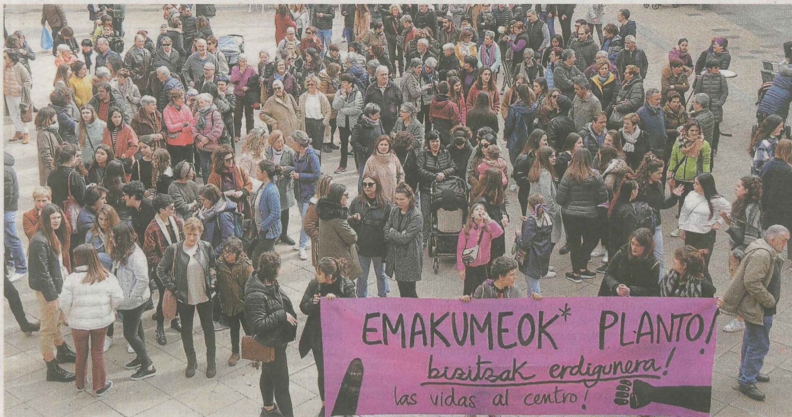
Numerosos vecinos se sumaron a la concentración realizada en la plaza del Ayuntamiento. SALEGI