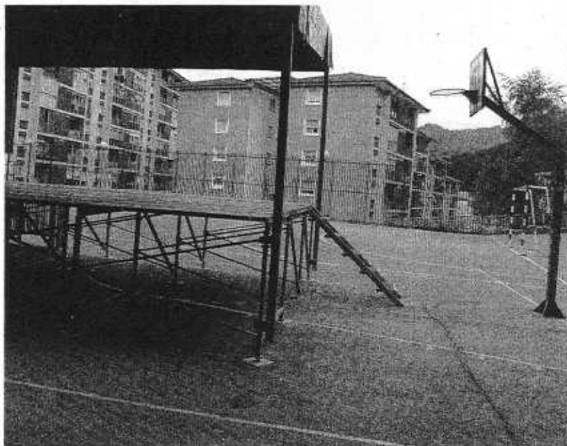
TODO LISTO. El escenario que acogerá algunas actuaciones, en el patio del colegio.