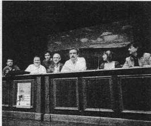
Acto sobre emprendizaje en el Instituto Uni (FELIX MORQUECHO)

En Armeria Eskola, más de 150 alumnos de Armeria Eskola de Eibar tomaron parte en la Semana del Emprendedor. Las actividades programadas en la escuela se han desarrollado a lo largo de toda la semana y culminaron ayer con un acto central en el que varios alumnos de Armeria Eskola que han impulsado actividades en diferentes ámbitos, impartirán una charla a otros estudiantes del centro. A lo largo de estos días, los alumnos de Armeria han participado en la fiesta del programa EJE en el Kursaal de San Sebastián. También se han podido ver en el hall del centro diferentes vídeos. Se colocó un stand divulgativo, donde se dieron cuenta de las particularidades indispensables para el emprendizaje. ■