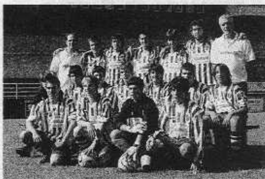
El Burumendi disputará mañana su encuentro frente al Martutene.

Por su parte serán cinco los grupos de spinning o de ciclismo indoor que se formarán con una duración de 50 minutos por grupo. Finalmente son 30 las bicicletas estáticas disponibles y hasta