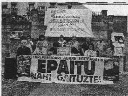
Askatasunaren kideen prentsaurrekoa.