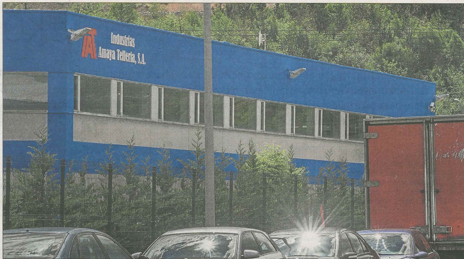
Instalaciones de Amaya Telleria en Zornotza.

El evento más visitado en el BEC el pasado fin de semana fue Expovacaciones (70.000 personas), seguido de la Feria del Vehículo de Ocasión (21.942). También acogió un foro sobre turismo, el encuentro de círculos de Podemos con Pablo Iglesias, una reunión de Testigos de Jehová y exámenes del IVAP.