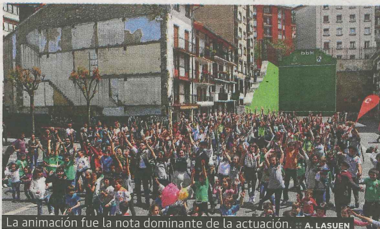
La animación fue la nota dominante de la actuación.

Ermuan Bagara, se reunieron el fin de semana en el centro del municipio para poder grabar allí un vídeo musical con el tema, elaborado por músicos locales, que representa a esa jornada por el impulso del euskera en Ermua. Esta grabación, organizada por Antxitxiketán, se hará pública en la pantalla gigante que se ubica en la que será 'Euskaldun berri plaza' a partir del 28 de mayo y en las redes sociales. En la celebración de la jornada participarán más de 40 colectivos locales de todo tipo.