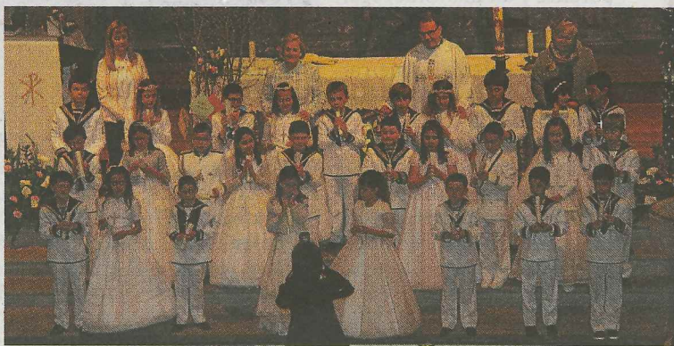
Foto de grupo de los niños que hicieron la Primera Comunión. :: A.S.

DEBA. La Iglesia de Santa María de Deba, acogió la celebración de la Primera Comunión de 28 debarras. Padres y familiares quisieron acompañar a los pequeños en este acto, en el que comenzó con todos reunidos en el claustro, para después desfilar hasta el altar. Una vez ahí, leyeron versos, tomaron la primera comunión y, para terminar, se reunieron en el claustro alrededor de una mesa para tomar una taza de chocolate con un bollo y un croissant. Los niños también se acordaron de la labor que realizan las catequistas en este día así como en días anteriores a la celebración. Por ello, dos niñas, obsequiaron la labor con un ramo de flores para ellas. En Itziar, 8 niños celebrarán la Primera Comunión este próximo domingo, a las 12.30 horas.