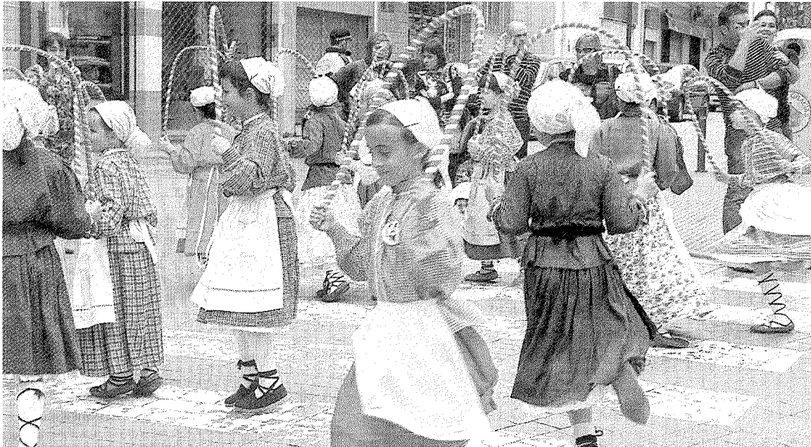
Una celebración anterior organizada por el grupo Txindurri en Ermua.