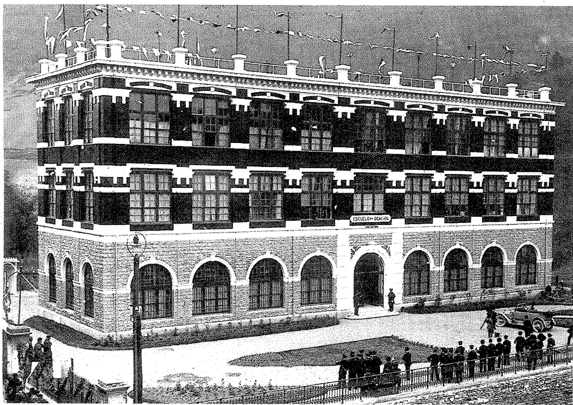
1914, inauguración del edificio de Armeria Eskola en la calle Isasi.

Cano, bajo la dirección de Sardo Irisarri. En esta ocasión serán los espectadores que se acerquen a la localidad guipuzcoana de Aretxabaleta los que podrán disfrutar de la obra, a partir de las 22.00 horas, en la Sala Arkupe. Las entradas se venden a un precio de 4 euros. Por otro lado, la agrupación teatral estrena mañana a las 18.00 horas en la terraza de El Corte Inglés la obra 'El Rey Xenón'. Se trata de un espectáculo teatral, dirigido al público infantil, que combina el trabajo de los actores y de títeres.