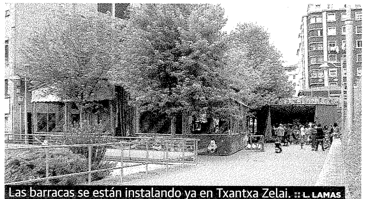
Las barracas se están instalando ya en Txantxa Zelai.