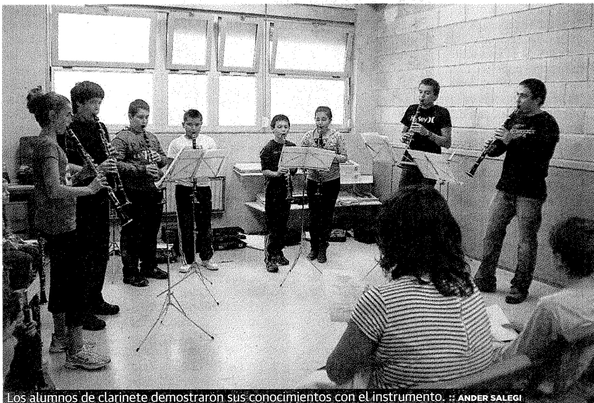
Los alumnos de clarinete demostraron sus conocimientos con el instrumento. ANDER SALEGI

La ikastola Anaitasuna de Ermua celebra el sábado su 'Ikastola Eguna'. Por la mañana habrá deportes y exhibición de tiro con arco en el patio B. Se desarrollarán también talleres, de las 10.30 a las 13 horas, en el patio de Educación Infantil y una actuación de grupos de la Escuela de Música, de las 12 a las 13 horas, en el patio cubierto del centro escolar. El alumnado también representará obras de teatro, entre las 10 y las 11 horas, en la sala interior, y pasando a la gastronomía, se disputará un concurso de tortilla de patata, a partir de las 12 horas en el porche. Los pequeños podrán practicar deporte rural de 10.00 a 13.00 en el patio C.