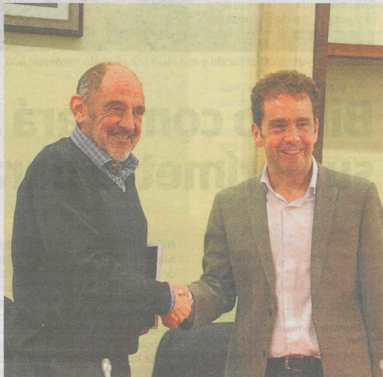
El alcalde y el responsable de Ura suscribieron el convenio. :: A. L.

Se trata de una obra que da continuidad a las obras que Ura acomete por fases desde 2013 para la mejora del saneamiento de los municipios de Ermua y Mallabia. Este conjunto de obras buscan derivar las aguas residuales de dichos municipios a los colectores del Bajo Deba. Para ello, se van construyendo tramos de los colectores que transporten las aguas residuales provenientes de Ermua, Mallabia y Zaldibar hasta punto de conexión en Eibar, para su posterior tratamiento en el EDAR del Consorcio de Aguas de Gipuzkoa.