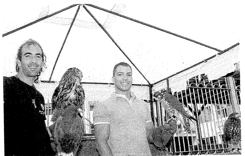
En el barrio de San Lorenzo se ha contado con aves de cetrería.

Hoy será la jornada dedicada a los mayores, por ello, a partir de las 19.00 horas se ofrecerá un lunch