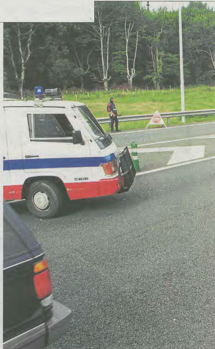
La Ertzaintza efectuó múltiples controles en las carreteras de Euskadi

Margarita Robles ha vuelto a la actualidad al ser nombrada por Pedro Sánchez como portavoz del PSOE en el Congreso de los Diputados. Su regreso a la primera línea política se ha producido tras varios años dedicada a la judicatura. Previamente, ocupó un puesto preminente en el último de los gobiernos presidido por Felipe González, en el que fue nombrada secretaria de Estado de Interior a las órdenes del superministro de Interior y Justicia, Juan Alberto Belloch. Fue una legislatura en la que el Gobierno español jugó a dos bandas: mano dura con ETA pero manteniendo un hilo de interlocución de cara a buscar alguna rendija que abriera la puerta a un final de la violencia.