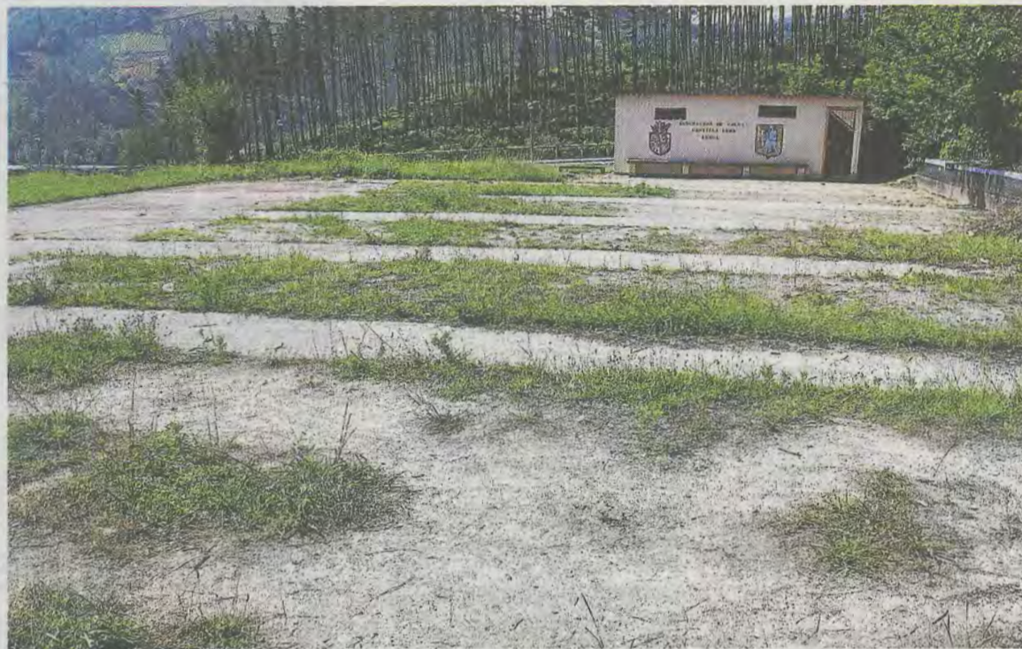
Zona de Betiondo donde se habilitará el nuevo espacio para la práctica deportiva de calistenia.

El circuito contará con 3 barras de dominadas, dos monkey bar,