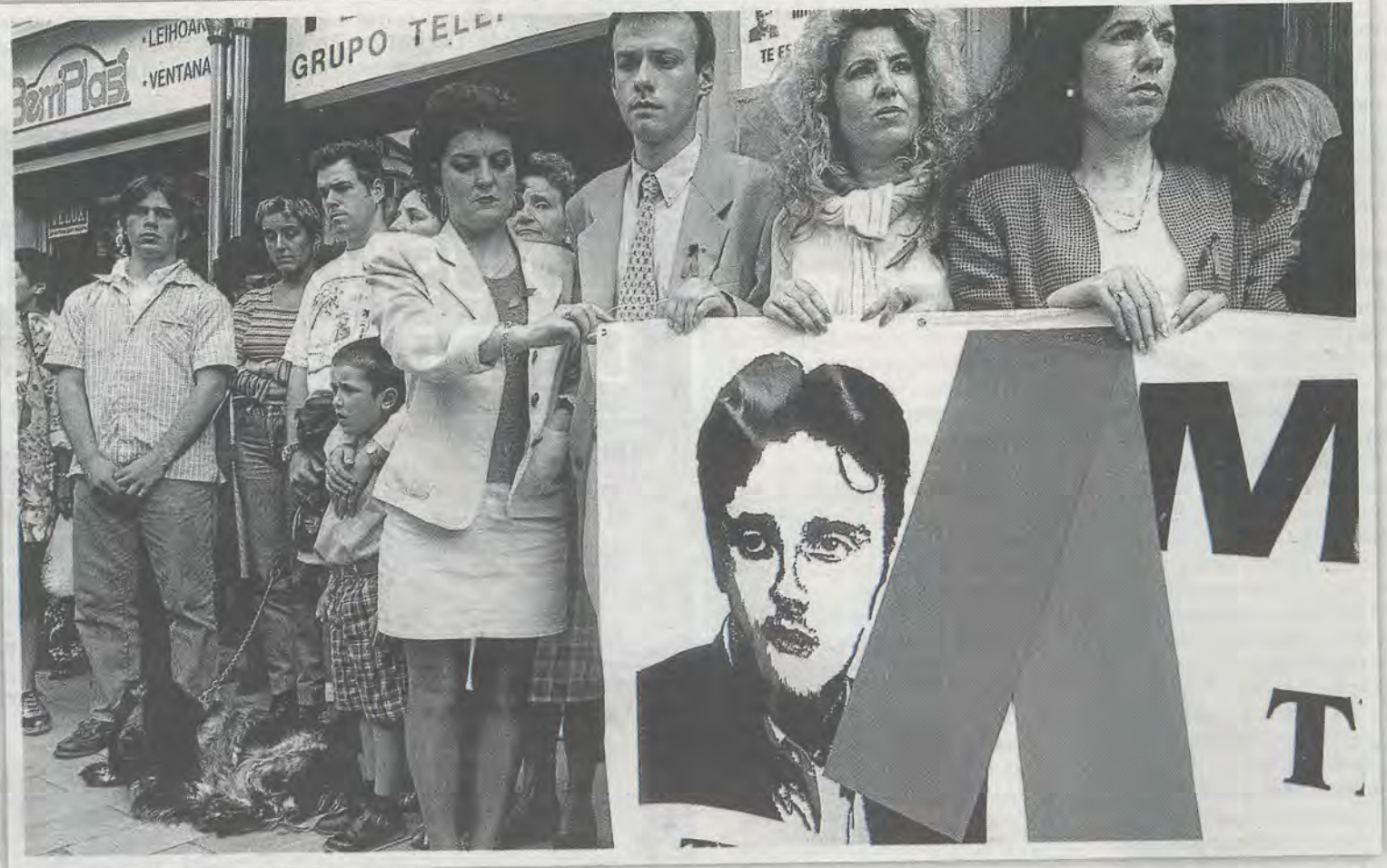
Los ciudadanos tomaron las calles entre el 10 y el 12 de julio de 1997 para reclamar a ETA la liberación de Miguel Ángel Blanco.

El acto más multitudinario se espera que sea la que protagonizarán Mariano Rajoy y la ministra de Defensa, María Dolores de Cospedal, en Bilbao. Ambos abrirán unas jornadas con mesas redondas que se alargarán todo el fin de semana y en las que participarán numerosos dirigentes de la formación.