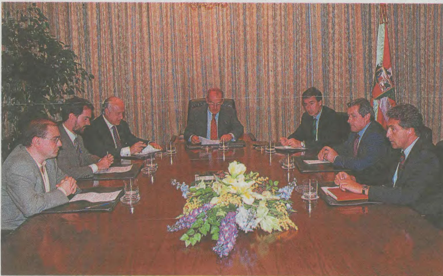
Julio de 1997. Tras el secuestro de Miguel Ángel Blanco, la Mesa de Ajuria Enea celebra una reunión para fijar su estrategia ante el devenir de los acontecimientos.