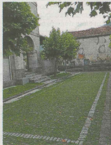
La vieja plaza de Garagartza será uno de los escenarios.

Los dos escenarios señalados acogerán a un total de 7 bandas de rock que en esta ocasión también llegarán de nuestra zona, pero también de otros rincones de Euskal Herria.