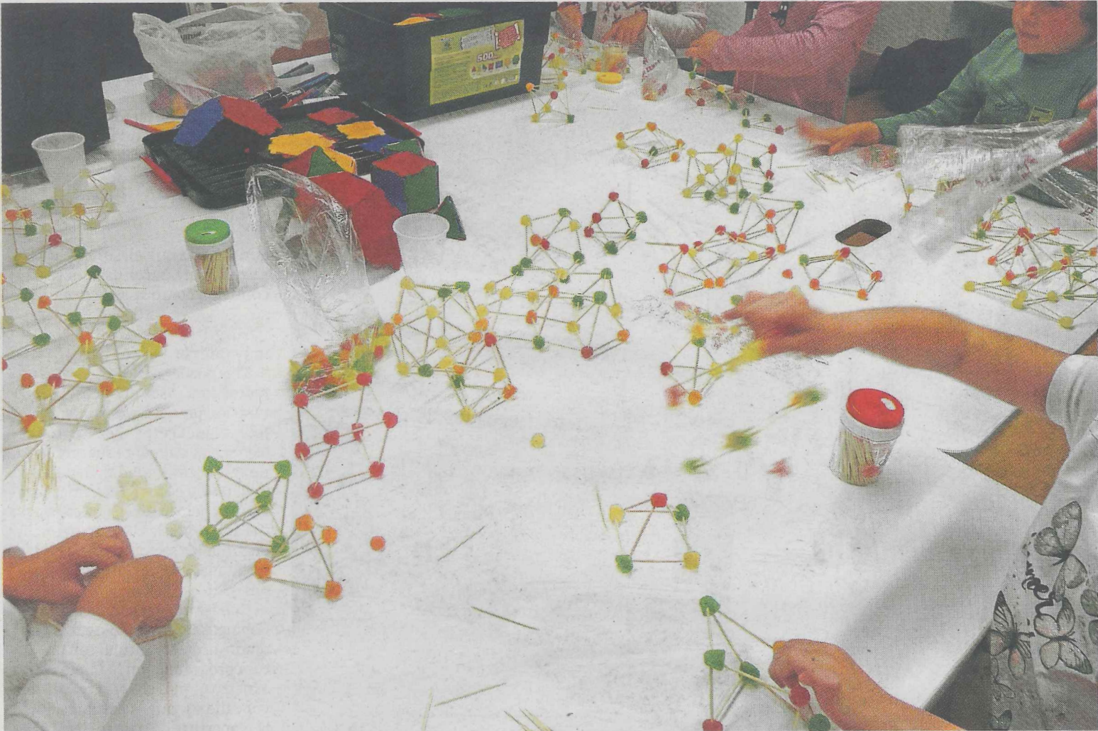
Un grupo de chavales participan en el taller de matemáticas organizado por la biblioteca municipal.