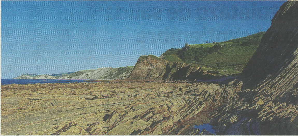
Ibilbidea Elorrixan hasi eta Sakonetan amaituko da.