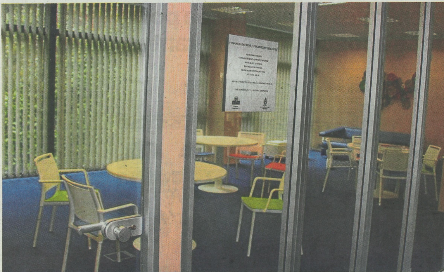
La Tecnoteka cuenta con salas de estudio en grupo para cubrir la imposibilidad de realizar trabajos colaborativos en la biblioteca municipal. E.C.