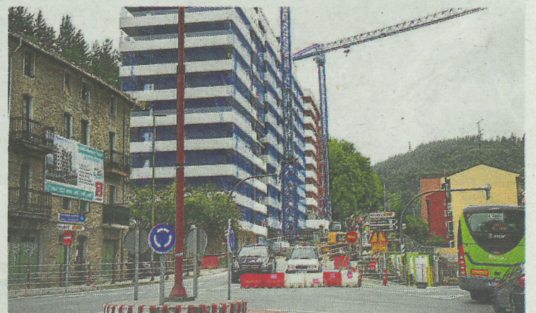
Las obras van a buen ritmo.

La empresa constructora ha optado por este cierre total de la carretera tras un exhaustivo estudio del tráfico de nuestra localidad realizado por la ingeniería Leber, para conocer mejor los flujos y optar por las actuaciones que generan menos afecciones. Los resultados arrojados por este análisis determinaban que la opción menos perjudicial para la ciudadanía y el tráfico era el cierre total de la vía, tal y como os contábamos aquí.