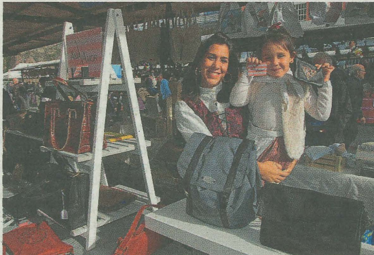
La Feria de Artesanía de Navidad volverá a la localidad el domingo.