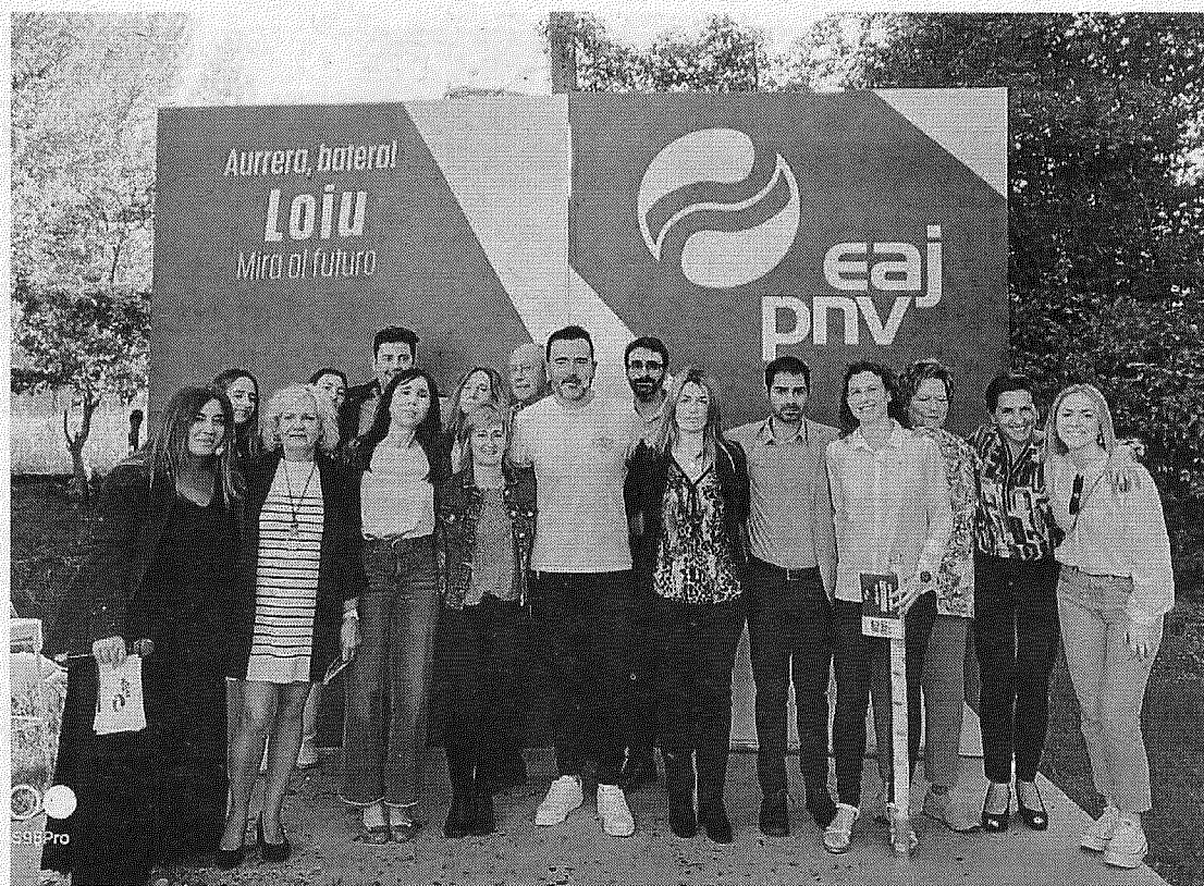
Los jeltzales presentaron su programa en el barrio de Larrondo.

la solo con filosofía y pancarta, sino con hechos, programas, prioridades y con recursos, y convirtiendo lo que dices en lo que haces. Por eso, los socialistas somos de fiar, sabemos gobernar”, añadió. Abascal afirmó que “son muchos los desafíos y retos que tenemos que abordar”. Tras poner en valor al equipo, destacó que, durante esta legislatura, toda la gestión municipal, especialmente durante la pandemia, se centró en defender a los vecinos, pese a que “Bildu y Podemos han hecho causa común en contra de los socialistas, porque su único y obsesivo objetivo es echar al PSE-EE del Gobierno”. – A. Salterain