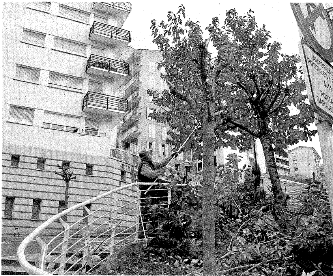
Uno de los participantes del último Plan de Empleo en labores de poda de árboles.

El sector más beneficiado en el 2013, puesto que ha descendido su número de desempleados durante todo el año, es el de los hombres entre 25 y 44 años, ya que había 45 personas menos en el desempleo desde entonces.