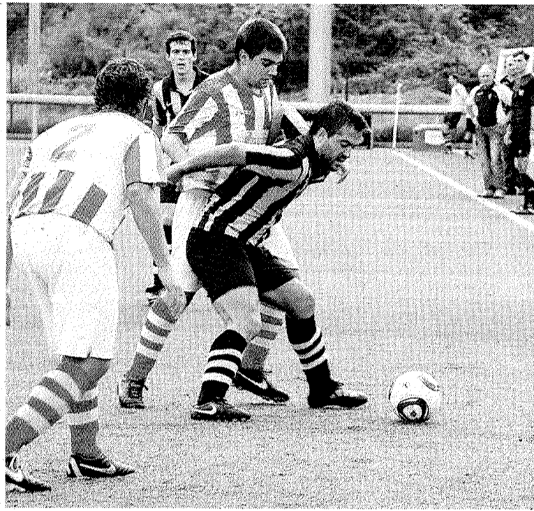
El Amaikak Bat de Preferente jugará hoy en casa.

Los cadetes están realizando un buen trabajo esta temporada, aunque la dureza del grupo les ha llevado a estar en la parte alta de la tabla, pero que tengan muy complicado los tres primeros puestos. La pasada jornada lograron un valioso punto ante el Tolosa, uno de los gallos del grupo, y eso les ha dejado