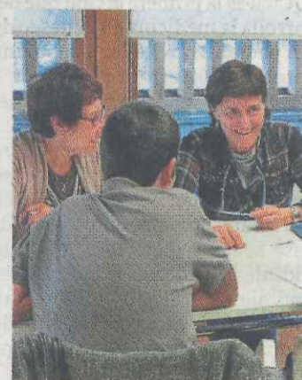
Un grupo de conversación.

Para poder participar es necesario ser socio o socia de cualquier biblioteca de la Red de Lectura Pública de Euskadi y tener capacidad para mantener una conversación en el idioma del grupo. El objetivo de esta actividad no es recibir clases, sino ayudar a hablar y exponer ideas en otro idioma. En caso de haber más solicitudes que plazas se realizará un sorteo entre las personas inscritas. En la actividad tendrán prioridad las personas del municipio. La inscripción puede hacerse en la propia biblioteca de Goienkale, llamando al teléfono 943179212 ó enviando un correo electrónico a 'biblioteca@udalermua.net'.