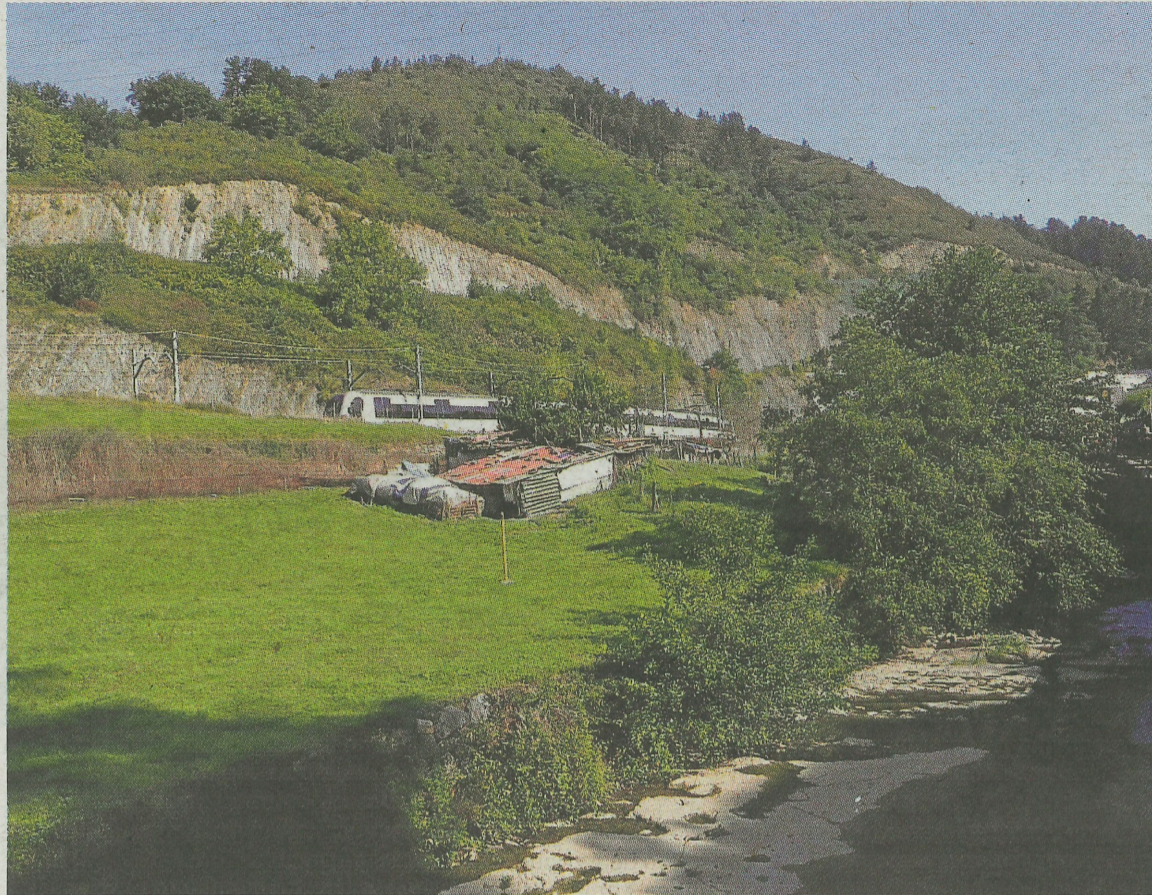
Un proyecto plantea construir un carril-bici y paseos en la margen del río entre Eibar y Ermua. ASKASIBAR

En principio, la Diputación de Bizkaia ha establecido una parti-