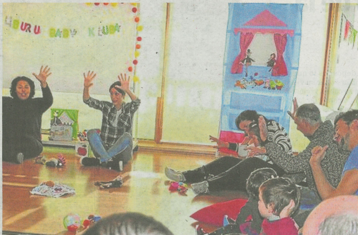
Estos talleres potencian la lectura desde un punto de vista lúdico y compartido con la familia. AVTO

'Liburu Baby Kluba' es una actividad lúdica y didáctica, dirigida a población infantil de 0 a 3 años y su familia. Su principal objetivo es fomentar en la infancia temprana el interés por la lectura, la música, el arte y la natu-