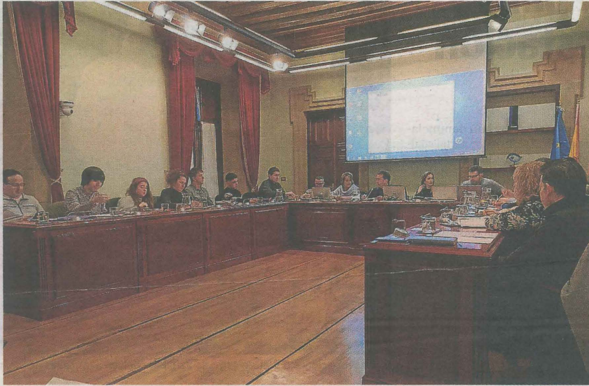
La oposición planteó en el pleno sus dudas y críticas a los presupuestos de este año. A. L.

Entre las partidas previstas el primer edil destacó las inversiones dirigidas al denominado Plan Especial de Santa Ana, que incluye la posibilidad de cesión de suelo municipal para instalar ascensores en los portales de San Roque, San Isidro y Santa Ana, además de la creación de dos elevadores públicos para mejorar el acceso al ambulatorio. Abascal también incidió en la importancia de las inversiones en empleo, «en las que aportamos 80 euros por habitante y 105 euros en promoción económica, más de dos veces y media de la media de los