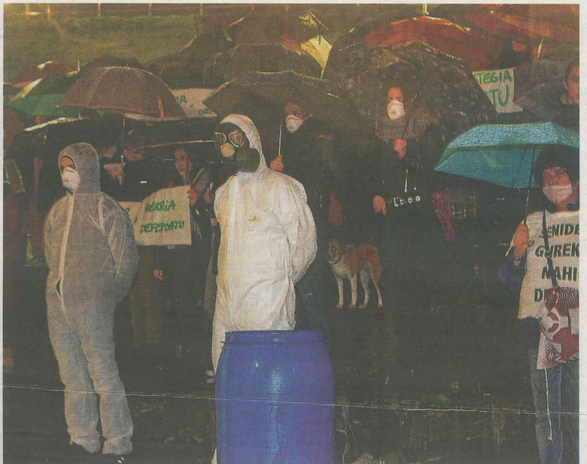
Las movilizaciones por el siniestro de Zaldibar vuelven a las calles de Eibar y Ermua.