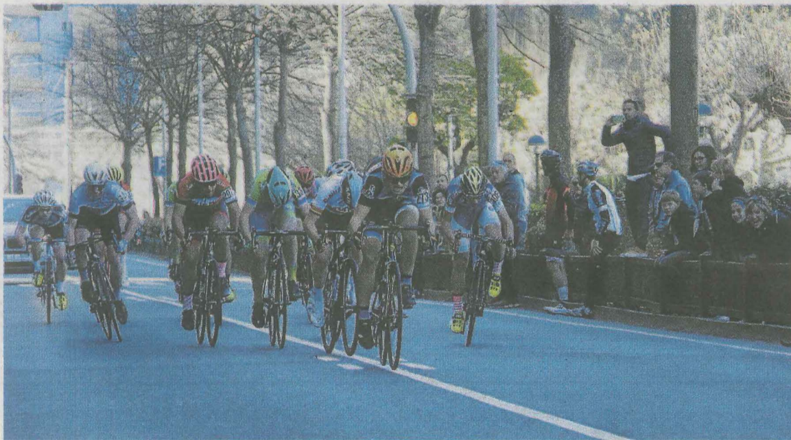
Los cadetes abrirán este sábado las pruebas que ha organizado el Amaiak Bat. A.S.

Los animales deben ir atados el día de la prueba para evitar ningún conflicto. Desde la organización quieren hacer hincapié en que no se trata de una carrera de montaña, sino de una marcha con opción de hacerla corriendo o andando, no hay clasificaciones.