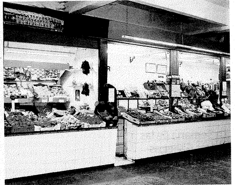
La plaza del Mercado, uno de los temas de esta tarde. :: GORRITIBERIA

Dado el horario de inicio de la mesa redonda, a diferencia de los anteriores será más reducido en cuanto a duración, pero quizás más