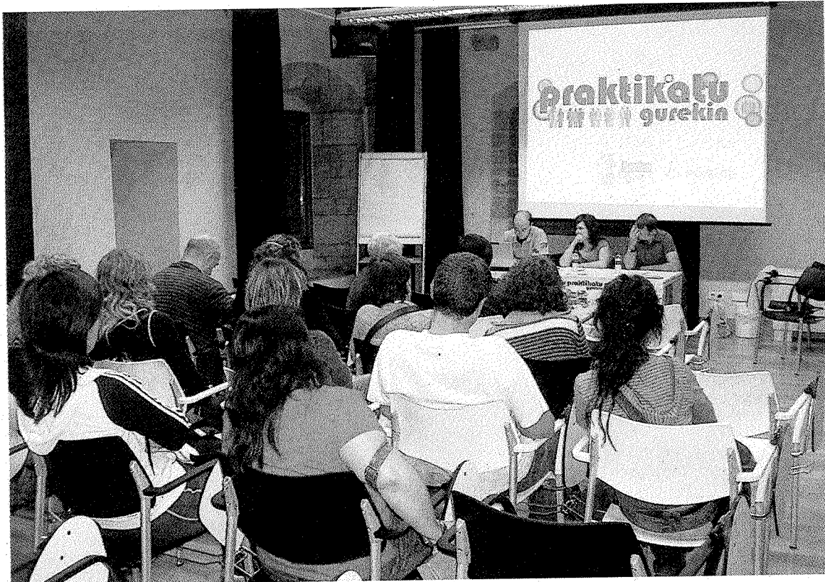
Presentación del programa 'Berbalagun' en Lobiano Kultur Gunea. ■■ A. L.

El programa de fomento del euskera hablado en Ermua, 'Berbalagun' cuenta este año con 59 participantes, aunque durante los últimos años se registra una partici-