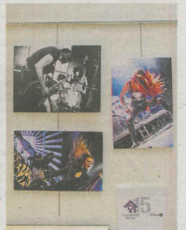
Exposición en Casa de la Mujer.

La muestra presenta a mujeres de bandas tanto nacionales como internacionales. Algunas de las artistas inmortalizadas por Endemaño son la sueca Elin Larsson, vocalista de Blues Pills; la canadiense Alissa White-Gluz, cantante de Arch Enemy; o la portuguesa Patricia Andrade, vocalista de Sinistro. También hay hueco para las mujeres vascas, como las bateris-