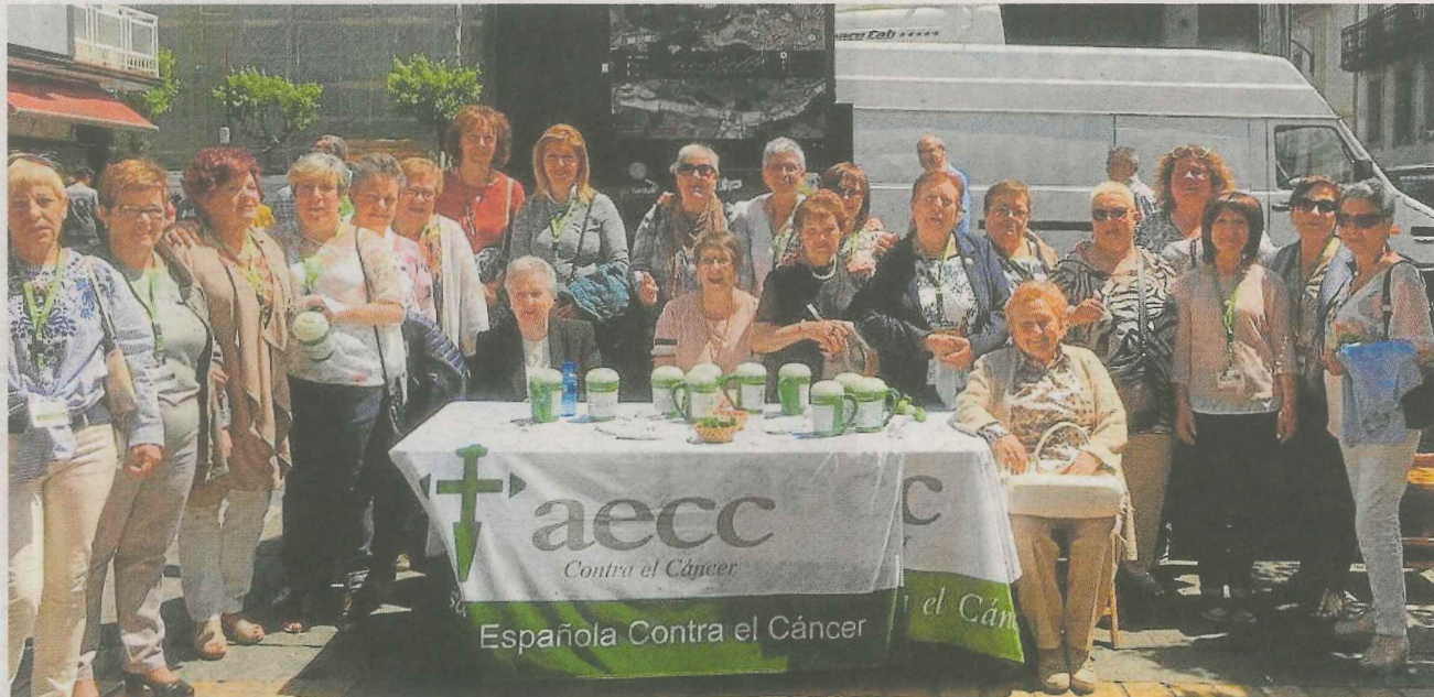
En la actualidad, son 35 los voluntarios con los que cuenta la Junta Local Contra el Cáncer de Ermua.