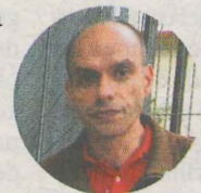
Isorid. Foto: K. Doyle

MÁS PROYECTOS Además de las mejoras en el colegio público, el Ayuntamiento de Berriz aprobó en la última sesión plenaria una partida de 200.000 euros para el proyecto que permitirá derribar parte del muro rodea al edificio consistorial. Además, la corporación municipal también dio luz verde a una partida de 195.000 euros para reurbanizar la calle Abeletxe. Tras las obras de mejora de Learreta Markina, la calle paralela también sufrirá cambios y es que pasará a ser de sentido único para entrar al municipio, mientras que Learreta Markina será de salida. Con estos cambios además surgirán nuevas plazas de aparcamiento en el arcén izquierdo. – K. Doyle