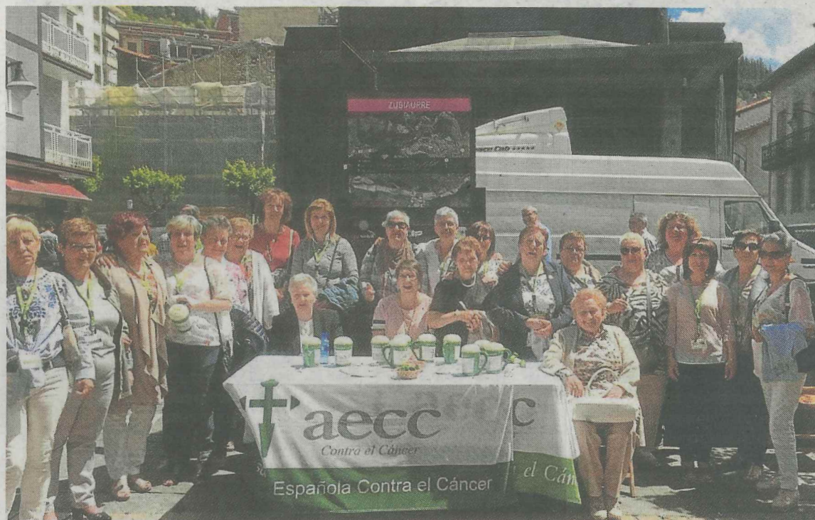
Una parte de las voluntarias de la asociación posan tras una de las campañas.

–Se cumplen ya 20 años del inicio. –Dos años antes el Ayuntamiento se encargaba de las cuestaciones y pasaba las huchas a los colegios y enviaban el dinero recogido a la asociación. Luego ya comenzaron las mujeres, en su mayoría eran enfermas. Todas han superado la enfermedad. Primero comenzaron con la cuestación, luego con la lotería, y después de la creación de la Junta Provincial, se organizaron con Bilbao. Ellas iban a Bilbao, traían las huchas o compraban los boletos de lotería, con su propio dinero, y cuando los habían vendido iban a por más. Llegaron a ser 38 o más. Ahora hay dos hombres voluntarios también. –Entonces ¿hay relevo?