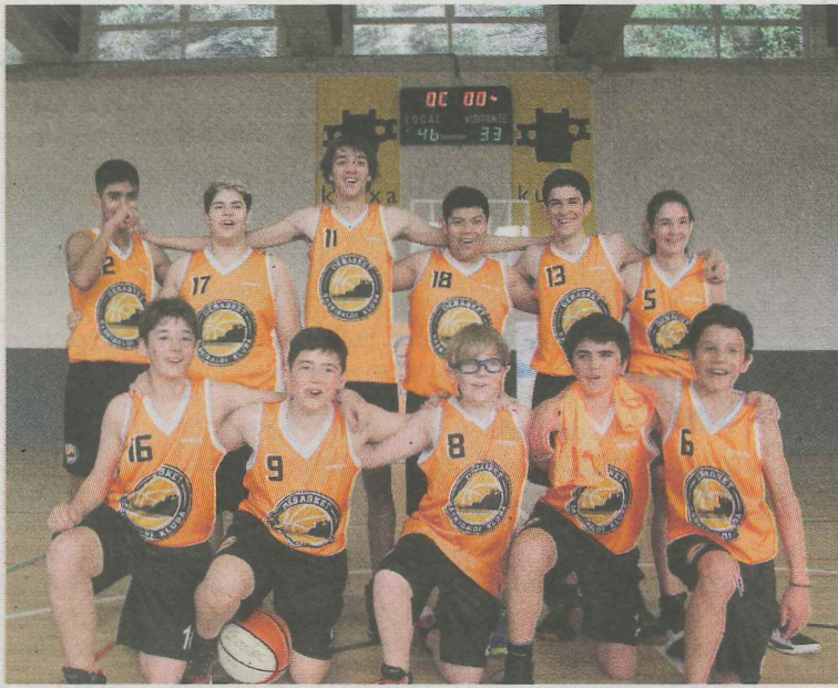
El equipo de cadetes, Gora Behera. ANDER SALEGI

Nueva victoria, 46-33, de Gora Behera Debasket contra los donostiaras Easo Urakorri. Los debarra fueron por delante en el marcador (balance de los cuartos; 16-6, 13-9, 7-5 y 10-13) en todo momento, controlando la ventaja de 10 puntos obtenida en el primer cuarto. El trabajo defensivo y la superioridad