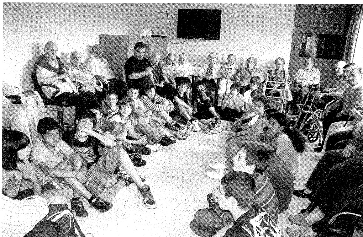
Los estudiantes y las personas mayores que han participado en el proyecto. A. L.