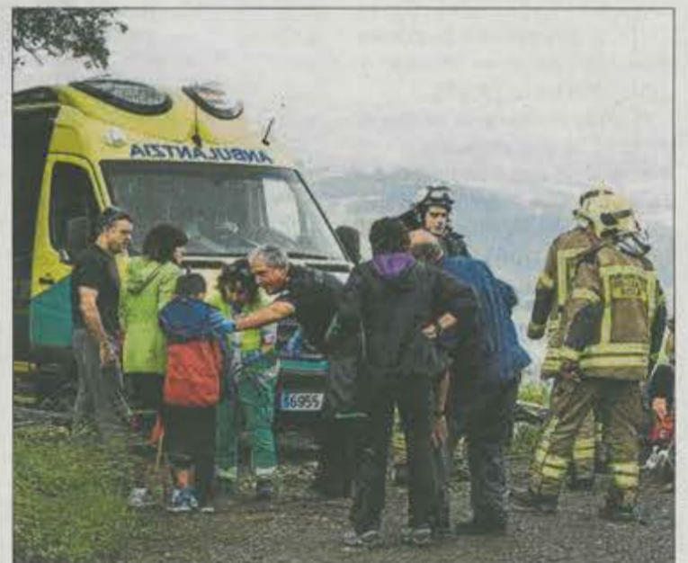
Lau lagun zauritu ziren gurutzea eraistean.

Ezbeharren ondoren Udalak ohar batean adierazi zuenez, udal teknikariek eta eraiketaren arduradunek gertatutakoa aztertuko dute. Gurutzea botatzeko beharrezkoak diren neurriak, «segurtasunekoak eta teknikoak», bete zirela esan zuen, baina «tamalez zoritzarreko istripua» gertatu zela.