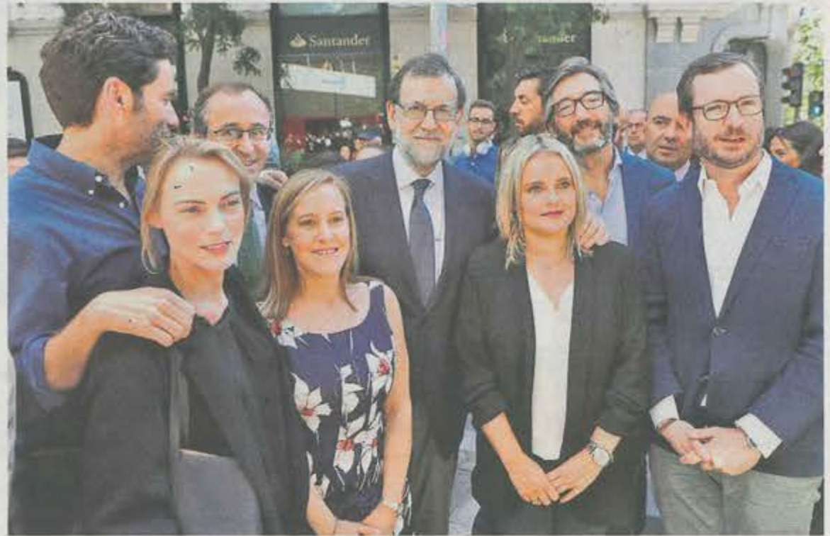
Rajoy, con varios dirigentes del PP vasco, ayer frente a la sede central de Génova.

A esos reproches se sumó la presidenta de la Comunidad de Madrid, Cristina Cifuentes, quien aseguró que Carmena tiene la «obligación moral» de colocar la pancarta. Carlos Iturgaiz, por su parte, tachó de «miserable» la decisión de la alcaldesa mientras, dijo, Podemos sí re-