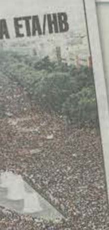
15 de julio de 1997 Las manifestaciones de repulsa se suceden en toda España y escenifican de forma masiva un rechazo que se traduciría en la ofensiva final del Estado contra ETA