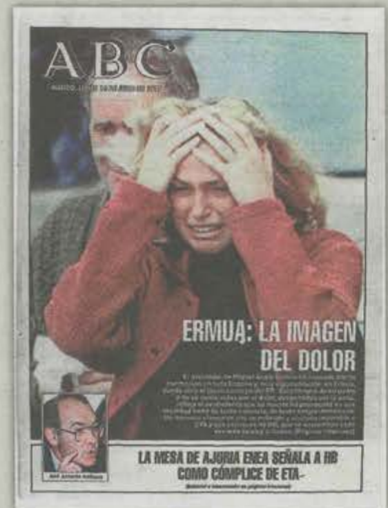
14 de julio de 1997 La localidad de Ermua se convierte en símbolo de la rebelión cívica que terminaría por aislar y doblegar a los asesinos etarras