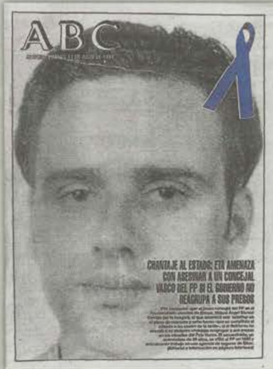
11 de julio de 1997 El rostro de Miguel Ángel Blanco llena la portada de ABC, que denuncia el chantaje de ETA al Estado y la sociedad española