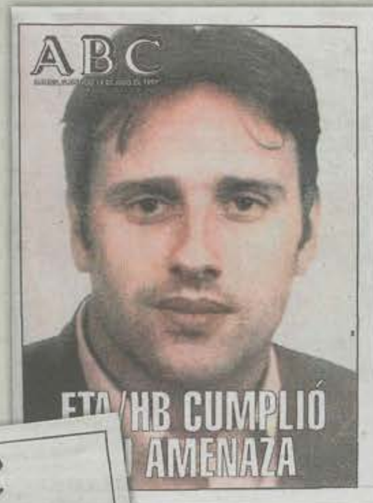
13 de julio de 1997 Tras el crimen, cuatro palabras fueron suficientes para trasladar al lector todo el horror de la banda terrorista