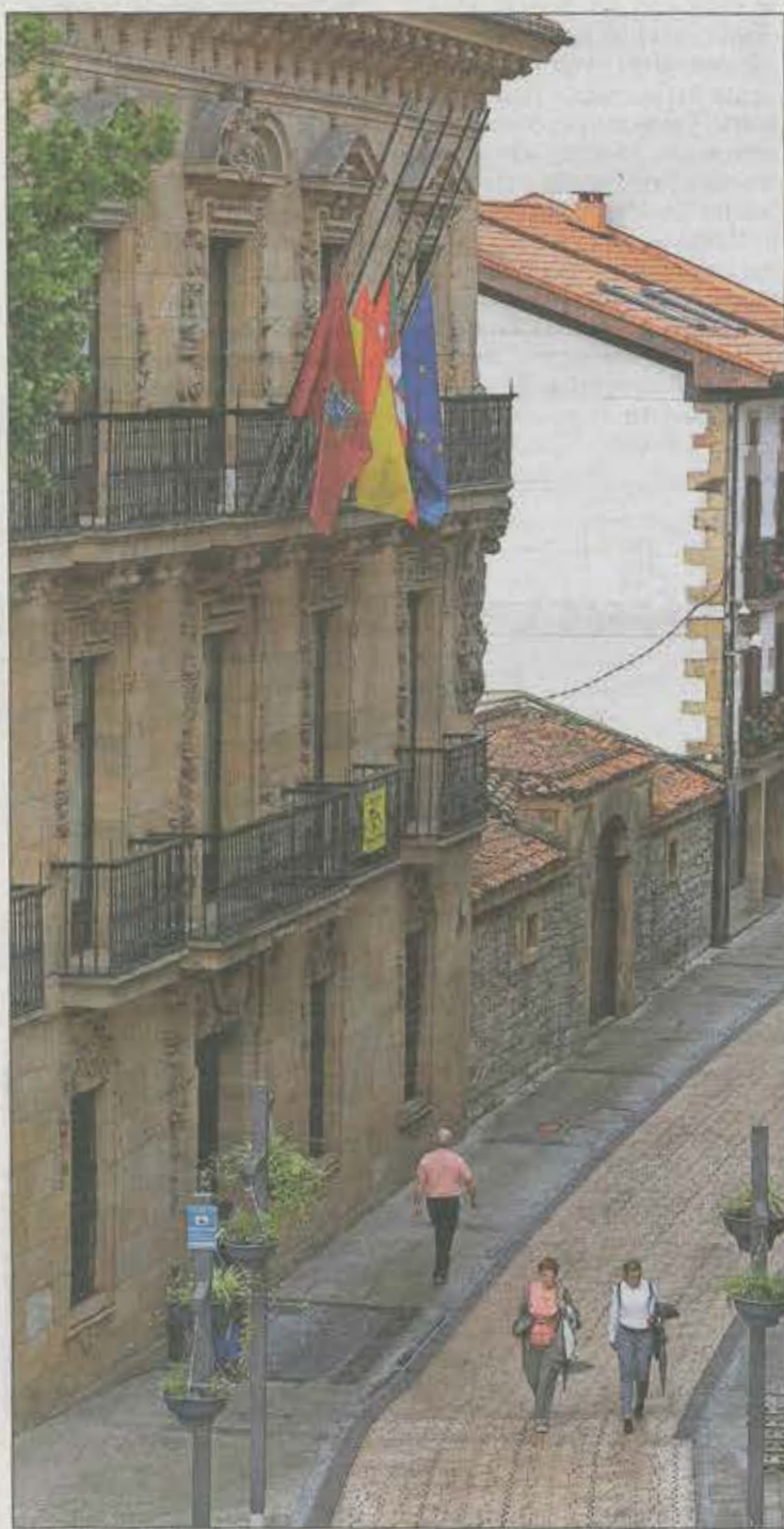
El Ayuntamiento de Ermua, ayer.

En el mismo asiento que ocupaba Blanco en el salón de plenos cuando era concejal se sienta ahora Fernando Lecumberri. Este edil del PP comió en un restaurante de Vitoria cuando el te-