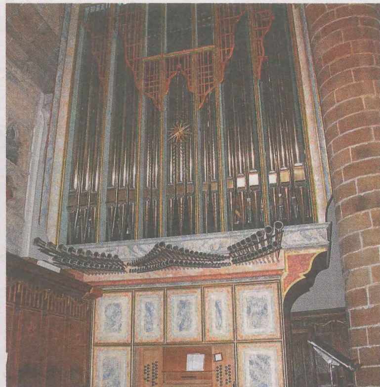
El órgano de la parroquia consta de 37 registros.