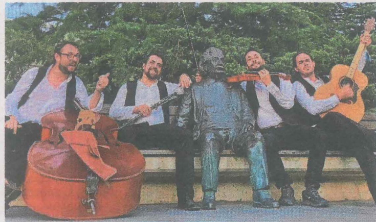
'Muyayos de raíz' será uno de los grupos invitados (sábado 21 h.). E.C

Para poder inscribirse en el taller se podrá acudir a la biblioteca, llamar al teléfono 943179212, enviar un 'whatsapp' a este número o escribir un e-mail a la dirección 'biblioteca@udalermua.net'.