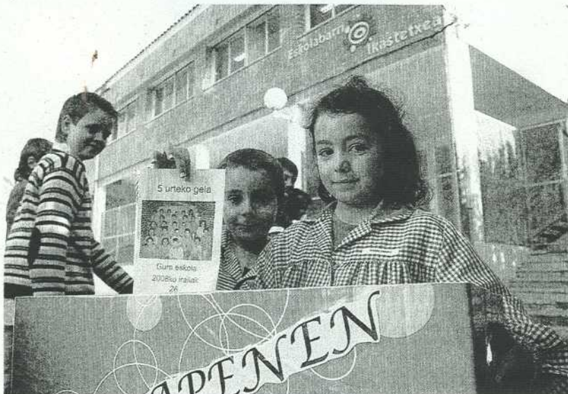
SATISFACCIÓN. Un grupo de escolares, en el patio de su nuevo centro.

Gracias a esta labor colectiva, el nuevo centro pudo inaugurarse el 9 de septiembre y durante los días 9 y 10 se celebró una jornada de puertas abiertas, para que todo el mundo pudiera ver las instalaciones, «en las que apenas hay que mejorar pequeñas cosas, aunque en los próximos meses pretendemos