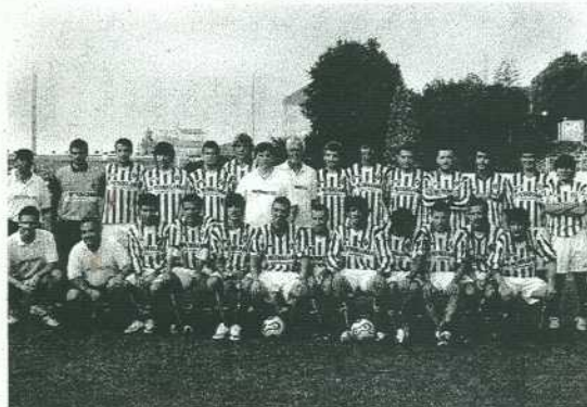
El Mutriku cuenta por victorias los partidos de esta temporada.

El Burumendi que vuelve a lograr victorias como la conseguida en la última jornada contra el Zumaiako, acudirá a Idiazabal donde jugará hoy, sábado, a partir de las 16.30 de la tarde. El equipo femenino también jugará a las 4 de la tarde en Txerloia frente al Anaitasuna y finalmente el equipo infantil masculino acudirá hasta Mojategi donde jugará mañana