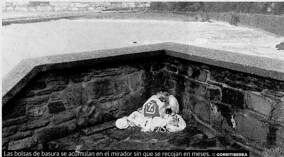
Las bolsas de basura se acumulan en el mirador sin que se recojan en meses. :: GORRITIBERIA

El siguiente curso de diseño de páginas web de 20 horas de duración se impartirá a partir del 4 y hasta el 13 de abril, los lunes, martes y miércoles, en las que el profesor será el propio director Lukas Rodrí-