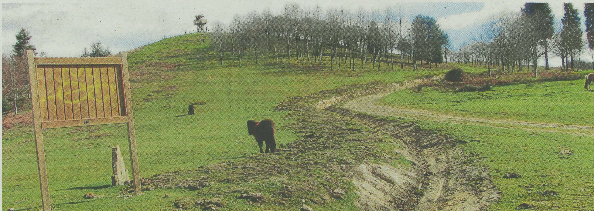
Animales pastan en las inmediaciones del mirador instalado en el Ilso Eguen.