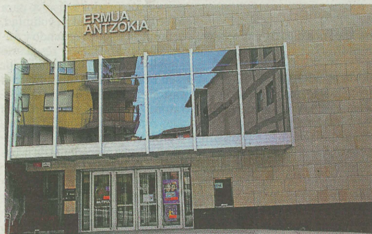
Esta semana no se proyectará una segunda película comercial. A.L.

Finalmente, en la sesión para el público más joven, se ofrecerá la película de animación, en euskera, titulada 'Yoko oporretan'. Será el domingo, a las 17.00 horas. Es una producción nacional dirigida por Juanjo Elordi con guion de Edorta Barruetaña.