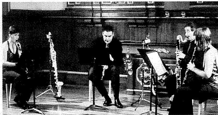
Componentes de Urval Ensemble en una de sus actuaciones.

Desde la organización han realizado un llamamiento para que acuda el público para que así los músicos se sientan arropados y sobre todo para que disfruten los melómanos dado que el concierto viene