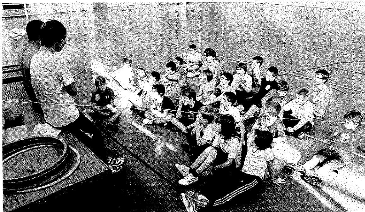
Las alumnas de Eli realizaron su espectáculo el año pasado en el frontón Aldats. ANDER SALEGI