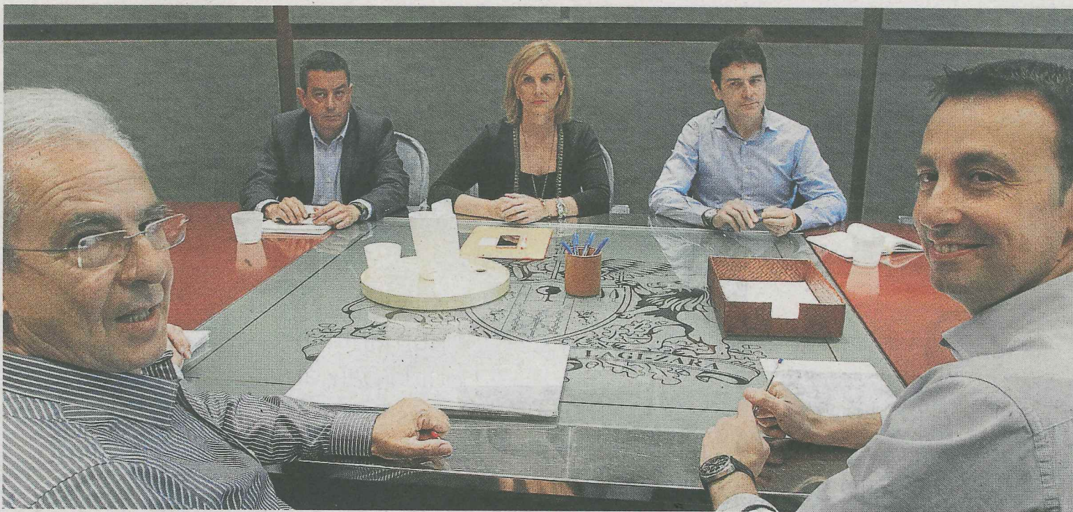
Sendas delegaciones del PNV y del PSE en Bizkaia, reunidas el pasado miércoles en Sabin Etxea.