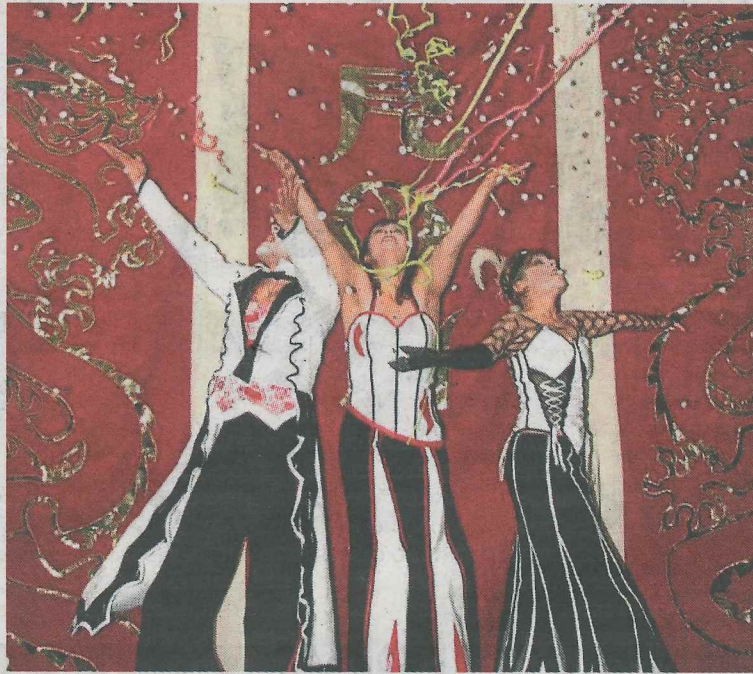
El cabaret se adueñará de la noche ermuaña. :: EL CORREO

Esta actividad dará comienzo a las 20.00 horas, enlazando con las múltiples actividades organizadas para