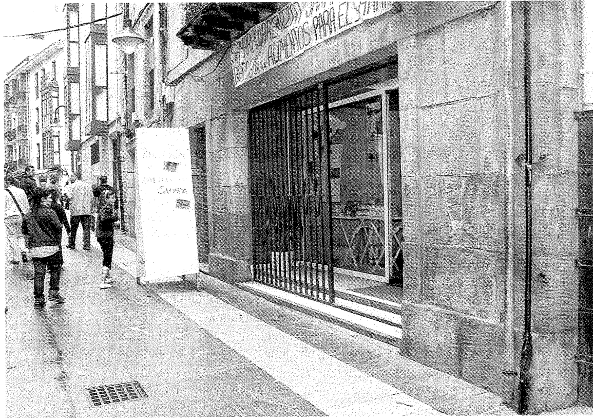
Local donde se ha llevado a cabo la recogida de alimentos y productos para los saharauíes. A. L.

También se han enviado 15 ordenadores, 7 impresoras, 3 escáneres