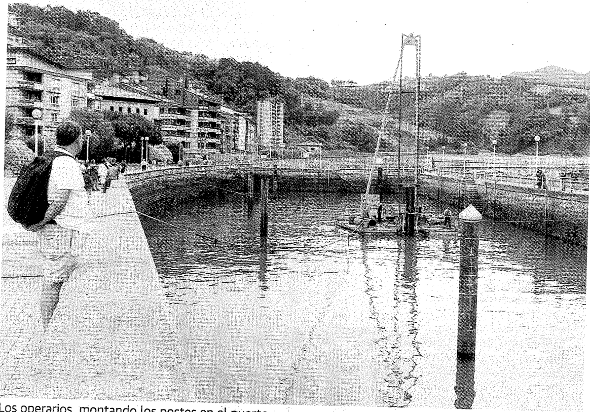
Los operarios, montando los postes en el puerto.

La visita en kayak se realizará los miércoles de julio; es decir, además de mañana, también los días 20 y 27. La hora de salida dependerá del estado de las mareas.