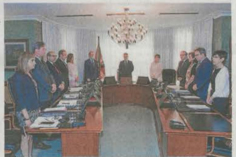
El Consejo de Gobierno guardó ayer un minuto de silencio.

El portavoz del Ejecutivo de Urkullu emplazó a a «poner el énfasis en la existencia» de estos actos en memoria de las víctimas. «Cualquier fórmula institucional es útil y puede ser válida para cumplir con el deber moral del reconocimiento y el homenaje a las víctimas del terrorismo», afirmó Erkoreka tras ser preguntado por las críticas al Ayuntamiento de Madrid por no celebrar un homenaje