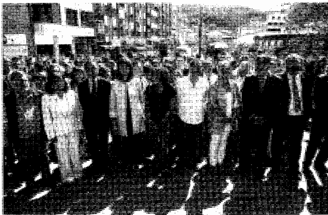
Alderdi guztietako ordezkariak, atzo, Ermuko San Pelaio plazan.