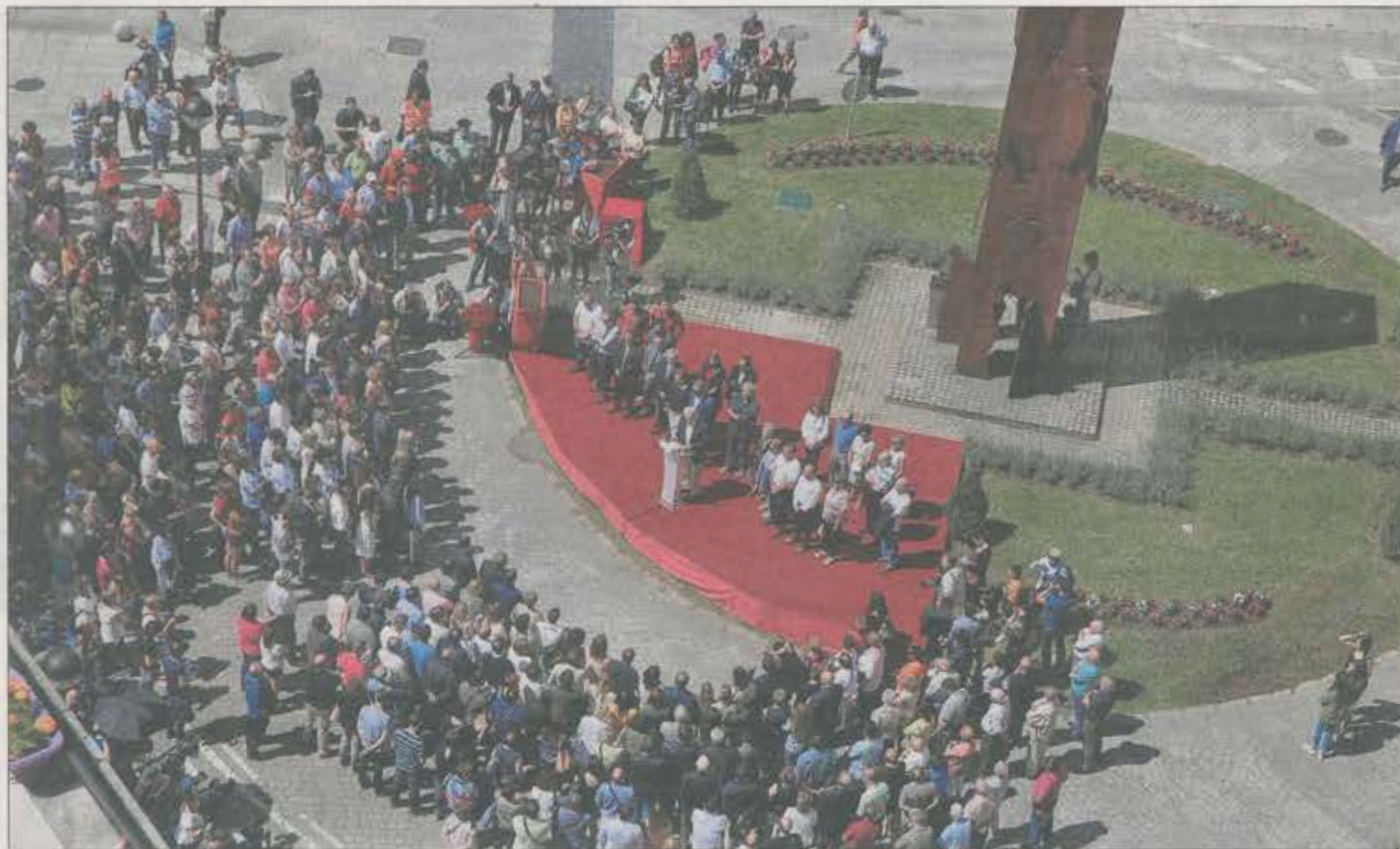
Homenaje a Miguel Ángel Blanco, asesinado por ETA hace 20 años, ayer en Ermua.

Los partidos vascos, incluido EH Bildu, asisten al homenaje a Blanco en su localidad. Fuera de Euskadi, las formaciones políticas enturbian el consenso