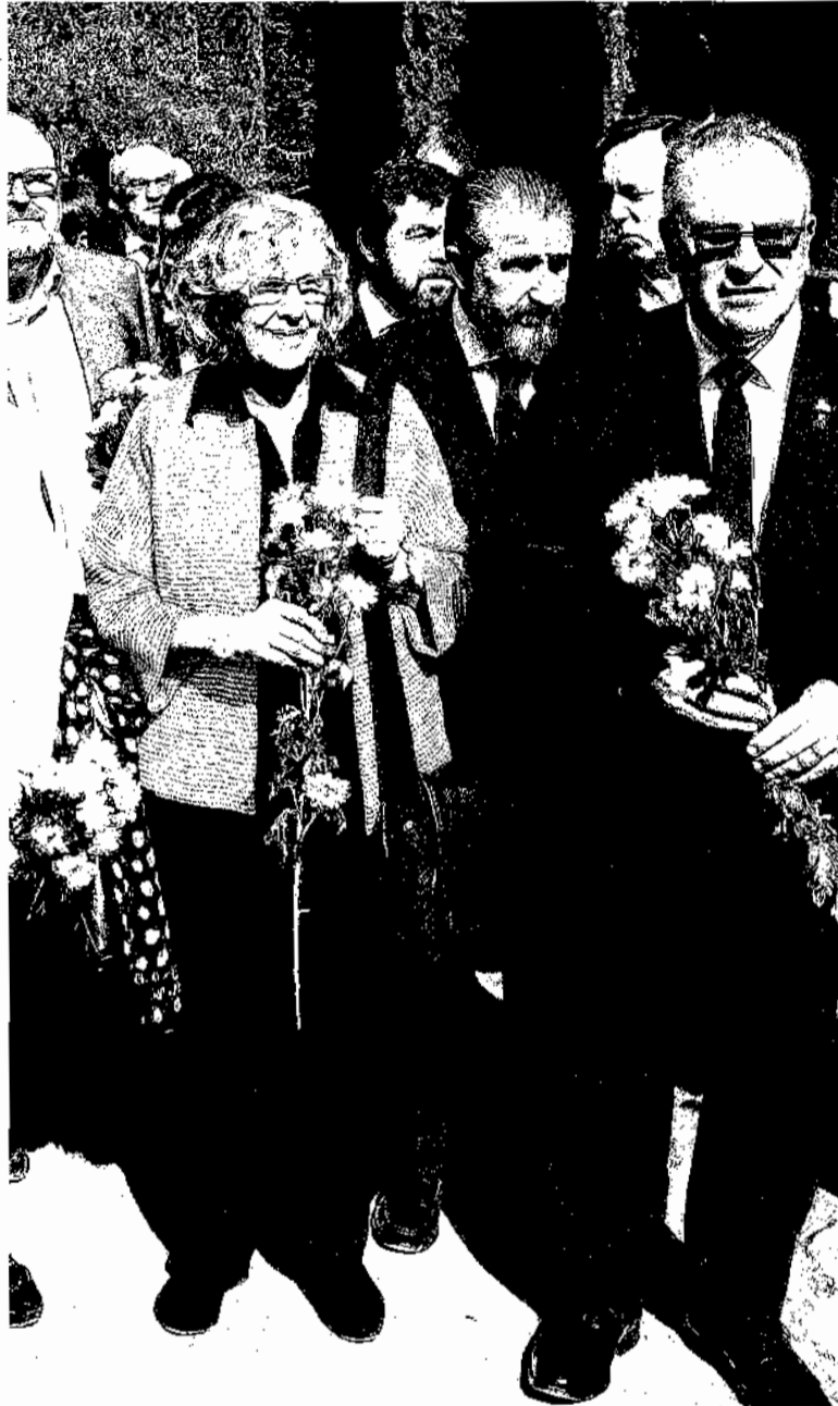
La alcaldesa de Madrid, Manuela Carmena, el pasado 11 de marzo.

Madrid rendirá tributo al edil, aunque no colgará una pancarta de la fachada del Ayuntamiento