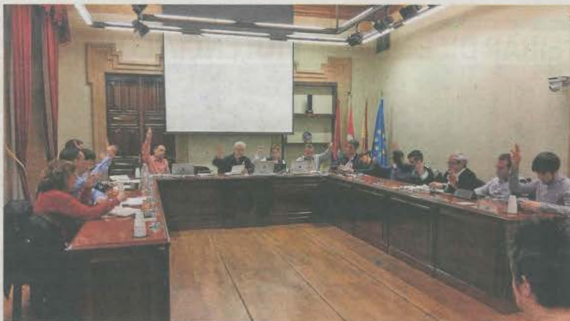
Pleno de la corporación ermuarra, con los ediles de todos los grupos municipales.

Por la misma razón de aplicación analógica, estas personas disfrutarán del derecho al permiso de lactancia hasta que el bebé cumpla un año. El permiso de lactancia consiste en el derecho al disfrute de una hora de ausencia del trabajo que se podrá dividir en dos fracciones (dos