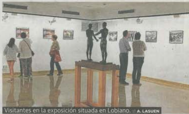
Visitantes en la exposición situada en Lobiano. •• A. LASUEN

«En Ermua desde el primer momento entendimos que cuando se le atacaba a Miguel Ángel, se nos quería atacar a todos, y cada acción de ETA se convirtió en una movilización ciudadana exigiendo libertad. Ermua consiguió que, con una actitud de lucha se le diera la vuelta a la historia del terrorismo de ETA». La muestra situada en Lobiano estará abierta de las 18 a las 20 horas, de lunes a viernes, y de las 11 a las 14 horas de la mañana, los sábados y domingos.