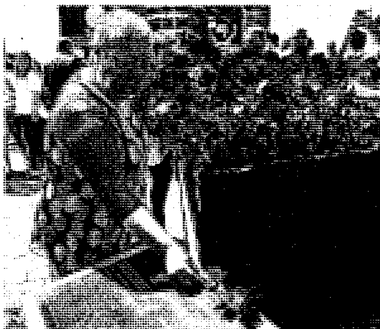
Ciudadanos anónimos participaron en el homenaje a Blanco.

El alcalde también puso en valor la crítica constructiva por los hechos del pasado como herramienta útil para alcanzar un futuro en paz, que en todo caso llegará “sin sembrar el odio, sobre todo entre los más jóvenes. Y es lo que se hace sí en su versión de la historia se sigue considerando héroes a los etarras aunque sea en la intimidad y antivascos a quienes no somos nacionalistas”, apostilló. “Solo así se puede evitar que se produzcan ataques como el de Alsasua a los guardias civiles. Que el matouismo político que impidió la libertad no se reproduzca”, concluyó. ●