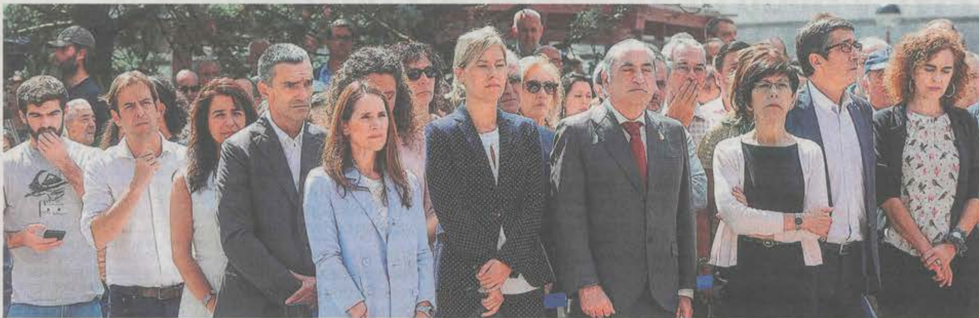
▲ Amplia representación. Todos los partidos y administraciones vascas y del Estado participaron en el homenaje celebrado en Ermua.