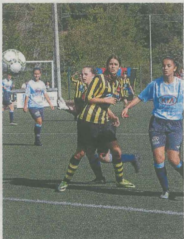
Del Olmo marca para el cadete.

El regional preferente femenino ha regresado a competición pisan-