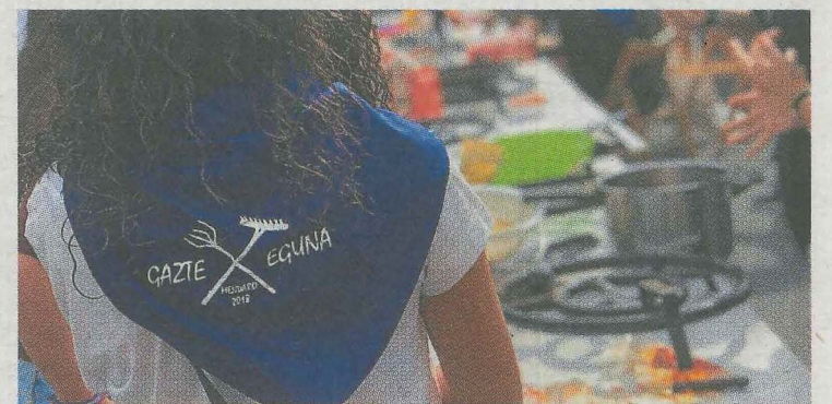
Herriko gazteak protagonista izango dira gaur. :: ZABALA