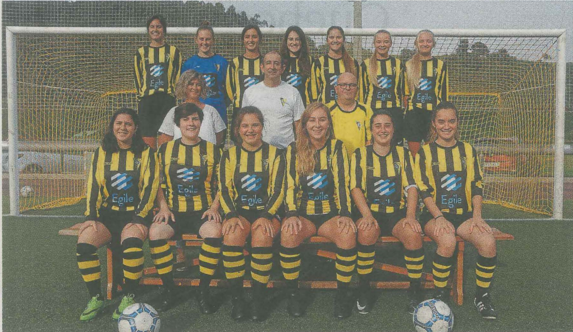
El regional femenino ha tenido un gran comienzo de temporada. :: FOTOS SALEGI