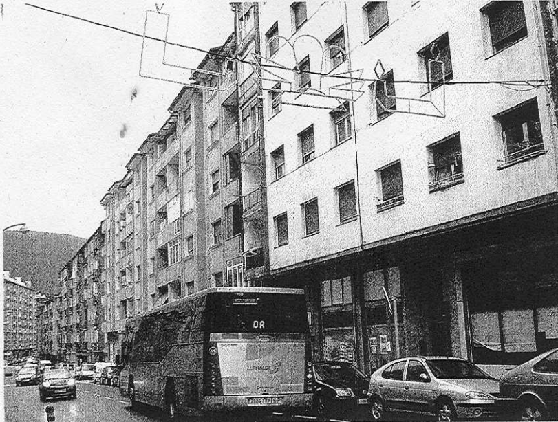
LUCEs. Adornos navideños en el casco urbano de Ermua.

Esta es la principal razón de que las luces de Navidad de la villa no se hayan puesto en mar-