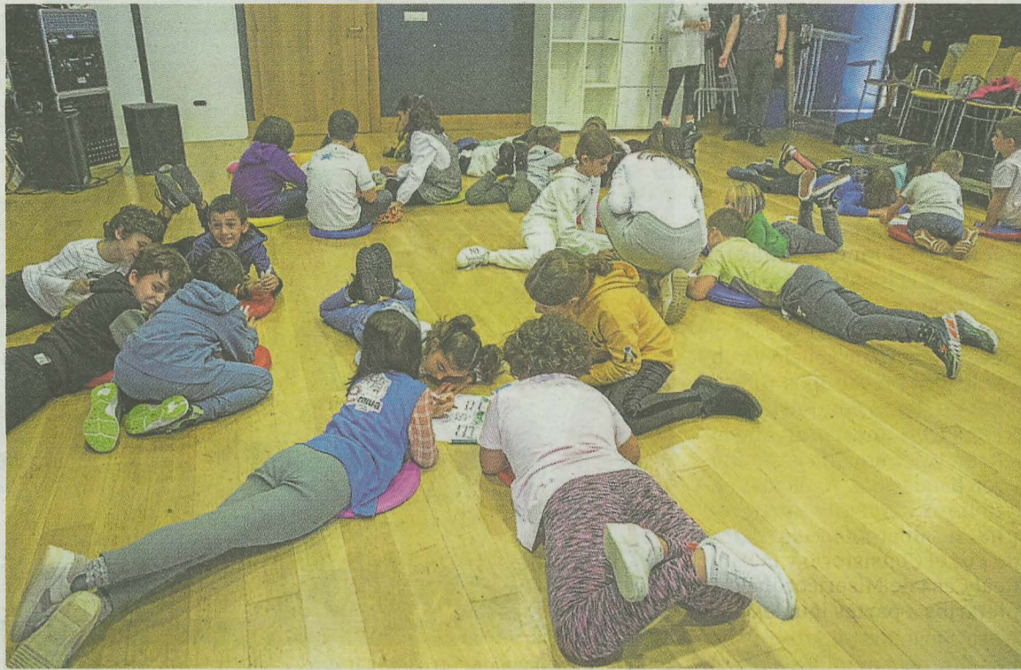
La infancia también ha contribuido en el proceso con propuestas para los Presupuestos 2023. AYTO.

mostrado su opinión, ya que el resto de las personas no han revelado su sexo y edad.