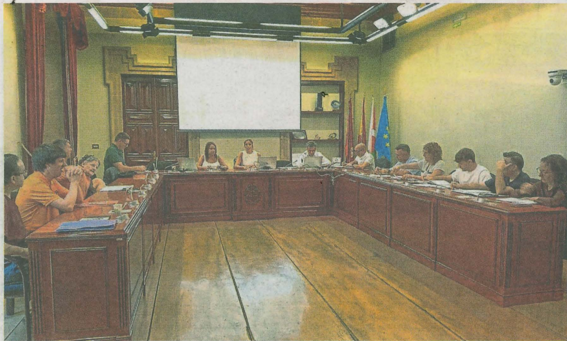
La modificación del Plan Estratégico de Subvenciones se debatió en la Comisión Informativa celebrada ayer. A. LASUEN

Se han previsto 16.000 euros para las familias con bebés de 0 a 2 años; 139.000 para la población entre los 2 y los 16 años; hasta 54.000 euros para estudiantes de Ermua de 16 a 25 años y, por último, 5.162 euros para personas desempleadas estudiantes mayores de 25 años. La solicitud de estas ayudas se abrirá en breve.