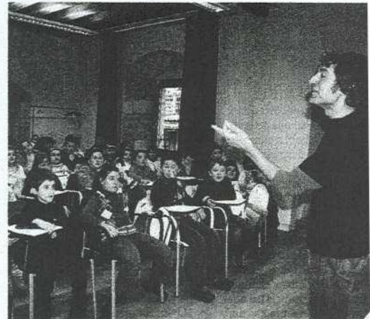
Encuentro de Arnal con los alumnos de Eskolabarri.

En caso de recibir a algún eurodiputado en la villa, esta no sería la primera vez, ya que en numerosas ocasiones se ha contado con la presencia de estos políticos, convocados bien a nivel institucional, bien por invitación del colegio San Pelayo, que trabaja desde hace años este tema.