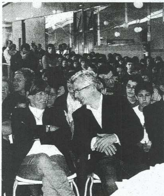
La eurodiputada Barbara Durkhop en una anterior visita a Ermua.

Frente al huracán que amenaza a todo un pueblo, una frágil criatura reposa es capaz de devolverle, con un simple batir de alas, los colores que había robado el viento y cambiar así la tristeza por alegría.