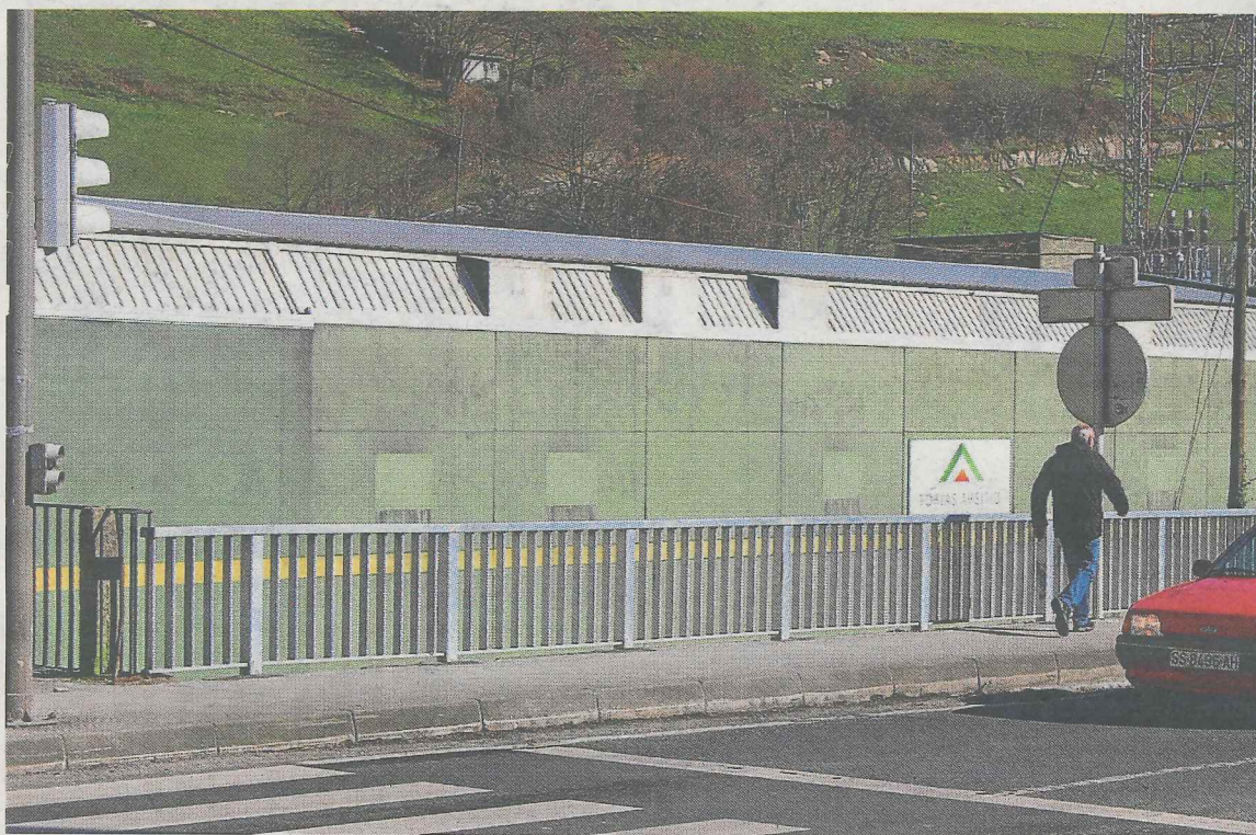
Empresa Forjas Areitio, principal afectada por la división realizada por la Diputación en 2007.

Según explicaron los técnicos municipales del Ayuntamiento de Ermua, en una Comisión Informativa anterior, los cambios que se pretenden hacer en la actualidad «servirán para reponer a Zaldibar y a Ermua los terrenos que antes del 2007 pertenecían a cada municipio». De hecho, en la Comisión se informó sobre que «en 2007, con motivo de realizar un reconocimiento de los mojones de los municipios, se levantaron diversas actas que se tras-