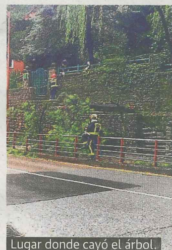
Lugar donde cayó el árbol.

La plataforma para la supresión del peaje de la A-8 instalará hoy en la plaza Cardenal Orbe una mesa informativa para explicar a los ermuarra sus reivindicaciones y la caravana reivindicativa que se celebrará mañana y partirá de Durango. La plataforma estará en la plaza de 18 a 20 horas. La caravana partirá el sábado del aparcamiento de las piscinas de Tabira (Durango) a las 11 horas y llegará hasta Ermua, realizando un recorrido del que las personas que lo deseen podrán informarse en la mesa informativa de hoy.