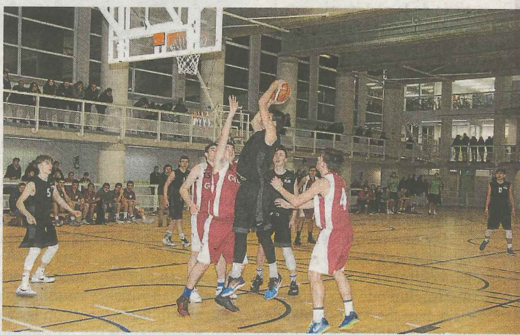
El baloncesto volverá a llenar el polideportivo de gente.

El campeonato comenzará hoy, a partir de las 18.30 horas, enfrentando a Álava contra Gipuzkoa. En el