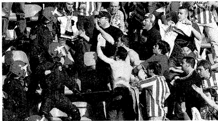
La Ertzaintza carga contra aficionados del Sporting en 2004.

EIBAR. El 2 de marzo el Eibar recibe en Ipurua al Sporting, en partido televisado por Canal Plus, a partir de las 12.00 horas. El partido va a ser de altos vuelos. Los gijoneses aspiran al ascenso y van a quemar todas sus naves. Vendrán a Eibar a por todas. De entrada, este domingo se espera en Riazor ante el Deportivo unos 7.000 aficionados sportinguistas. El Consejo del Eibar empieza a pensar medidas, aunque aún no ha tomado decisiones, ante el encuentro. Evidentemente, Ipurua no tiene la capacidad de Riazor. Además, de la temporada 2003/2004 existe el peor recuerdo por el comportamiento de la afición del Sporting en Ipurua, donde generó graves incidentes con tres detenidos y diez heridos. La Ertzaintza cargó en las gradas de Ipurua en la zona don-