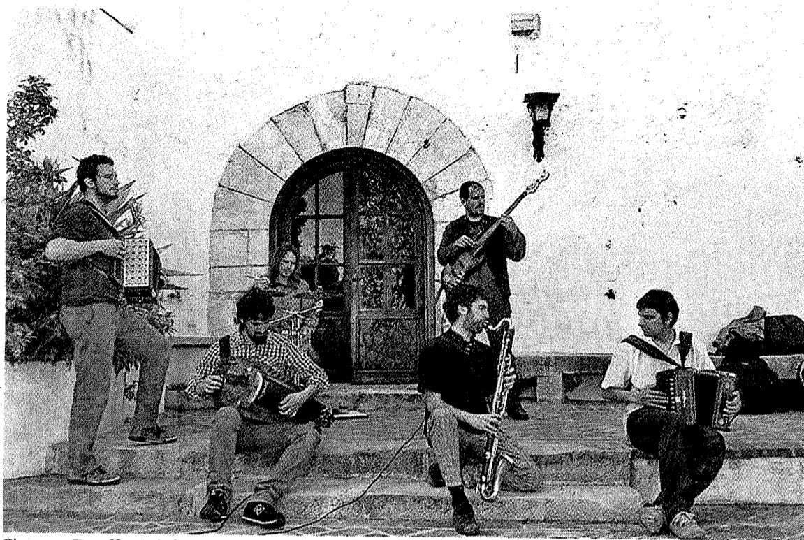
El grupo Tazuff resultó ganador en la anterior edición del 'Folkez blai' de Ermua. ■ E. C.

Durante el transcurso de esta segunda fase se cuenta también con la presencia de un grupo ya consagrado de la música folk y el grupo ganador de la pasada edición, que ofrecen un concierto en el mismo