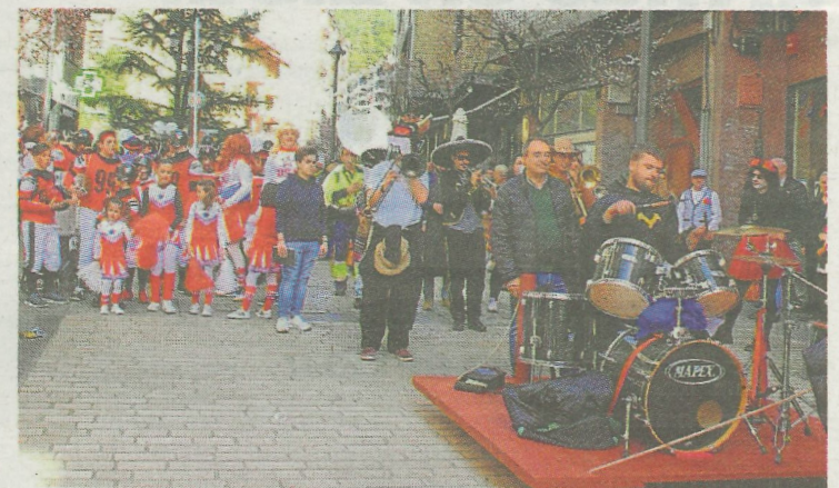
La música de la txaranga local Irulitxa también animará el desfile. A.L.

Se valorará la elaboración de los disfraces, así como la utilización de elementos acordes con el tema elegido y la realización de bailes, música, coreografías, etcétera.