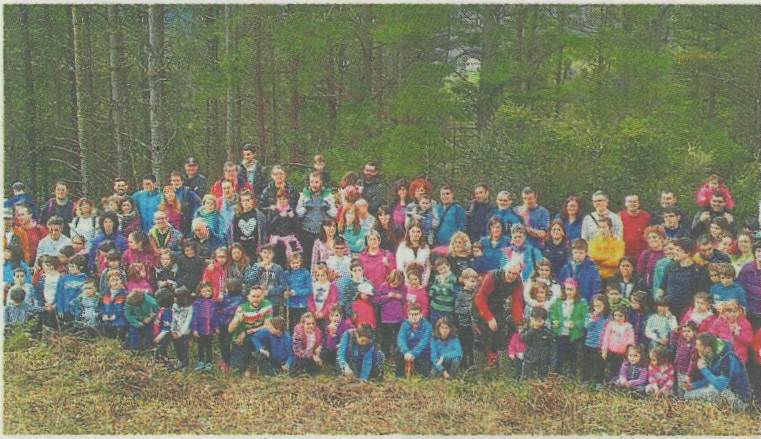
Participantes en una de las anteriores ediciones del Zuhaitz Eguna. E.C.