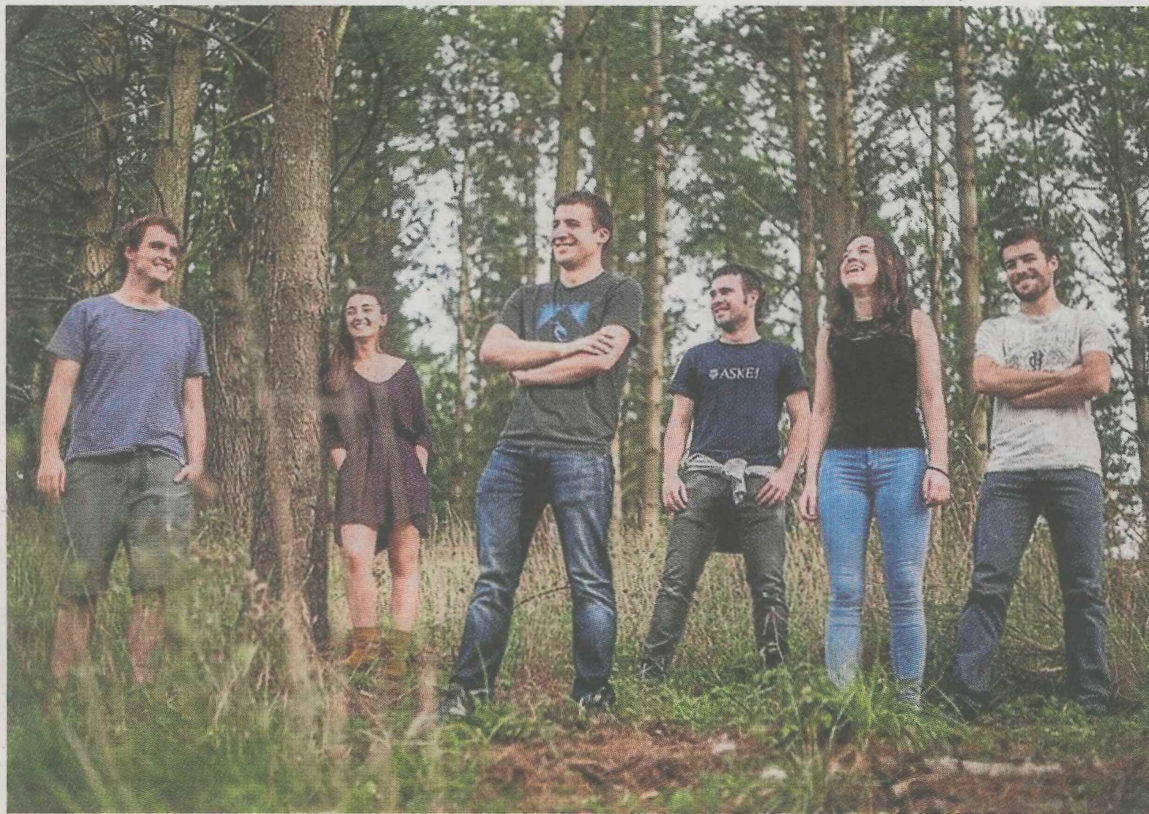
El grupo Huntza actuará mañana por la noche en Cardenal Orbe. ■ E. C.

El concierto del grupo Huntza se iniciará mañana a las 23.30 horas en la plaza Cardenal Orbe. Se trata de