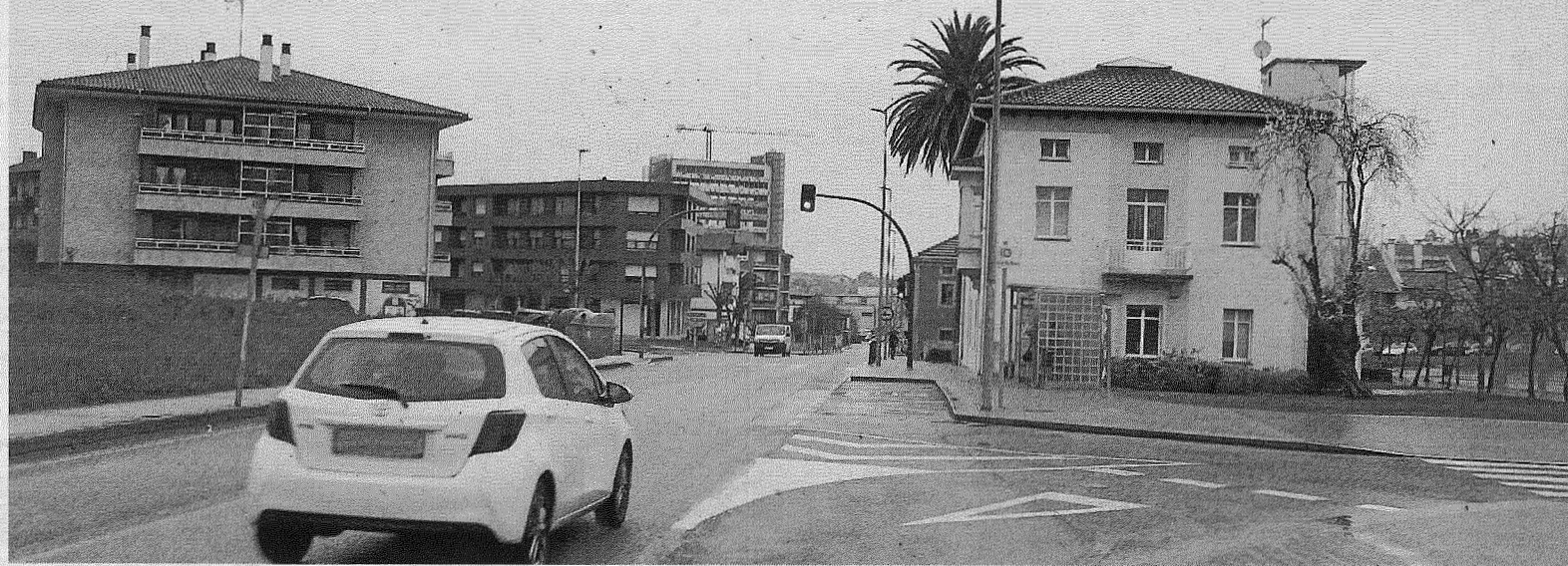
La nueva partida presupuestaria contempla la creación de más zonas de aparcamiento en la zona de Krutzejada.

Destacan la reurbanización de la zona del metro y el nuevo vial por detrás del Ayuntamiento