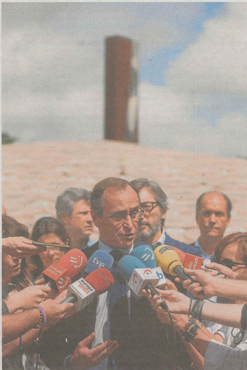
El presidente del PP vasco, Alfonso Alonso

En este contexto, Alonso consideró ayer que la memoria del concejal de Ermua «es hoy más necesaria que nunca». Principalmente, por la «preocupante deriva» que puede producirse en el marco del debate para la reforma estatutaria, pero también por la «desidia» de las administraciones a la hora de «aplicar medidas necesarias para cultura la memoria democrática». Dicha incuria puede apreciarse incluso en el ámbito educativo, aseveró el popular, que recordó que casi la mitad de