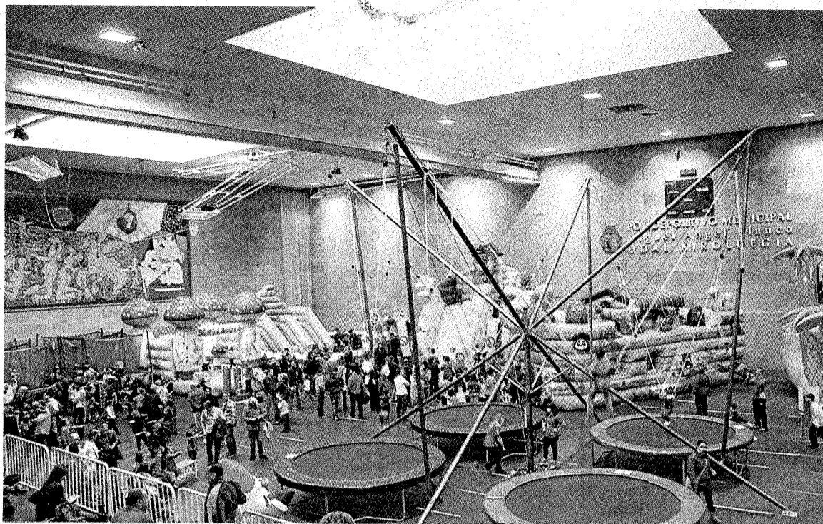
El Parque Infantil de Navidad volvió a ser la gran atracción durante las pasadas fiestas en Ermua. ■ A. L.