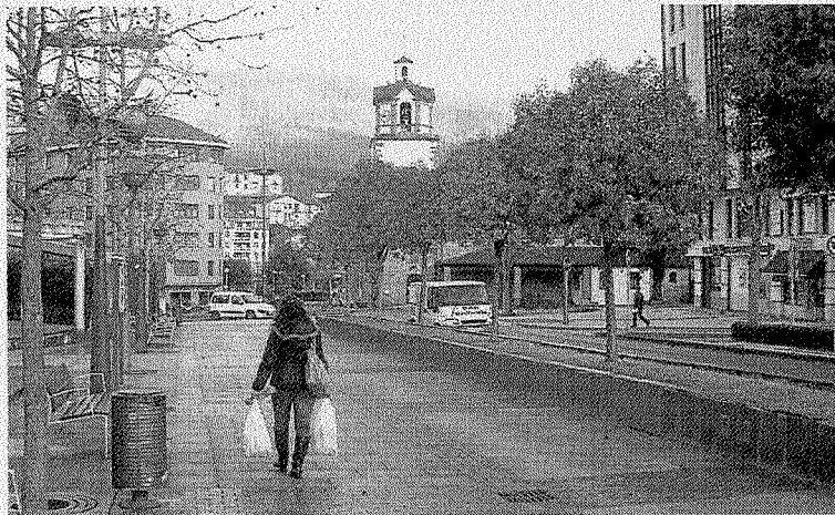
Los vecinos han colaborado en el diseño de las cuentas.

Los habitantes de la localidad han dejado constancia de sus inquietu-