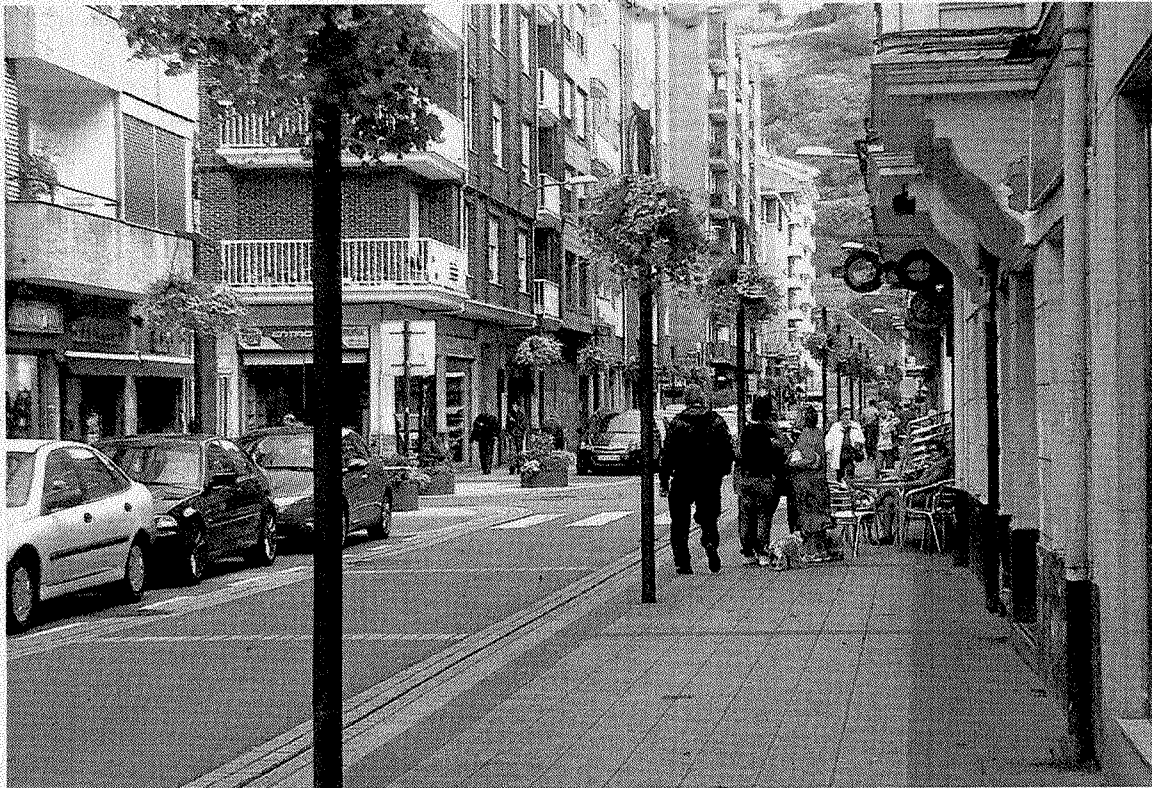
Una imagen de las calles de Erandio, cuyo Ayuntamiento ha apostado por el gasto social.

"Acabamos de dejar atrás un año difícil en el que muchas familias de nuestro municipio han enfrentado situaciones complicadas", afirma el alcalde de Erandio, Joseba Gokouria. Así, el regidor apunta su compromiso de que "ninguna persona residente en Erandio y que cumpla las condiciones para acceder a las AES se quede sin ayuda". "Aunque no tenemos obligación legal, no queremos dejar desatendidas a las familias que, en este con-