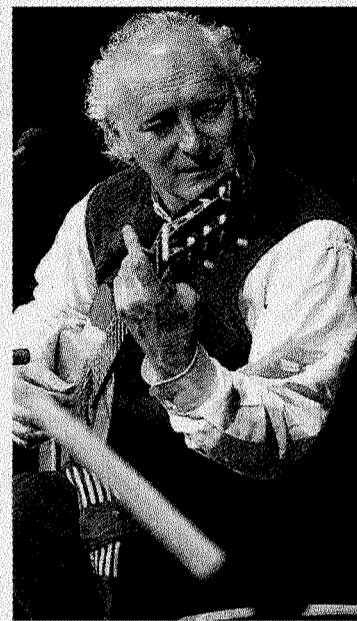
El cantautor Amancio Prada.

temente temas en gallego, su lengua familiar, hablada en la región de la que procede, El Bierzo.