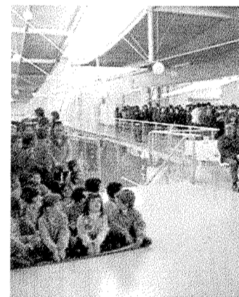
Una actividad de las jornadas.

Hoy, último día de las jornadas, contarán con la colaboración del colegio Maristas de Durango para desarrollar talleres sobre Diseño, Administración y Electricidad y Curso de Orientación de Oportunidades de Formación para el Empleo, dirigidos tanto a alumnado como a las familias.