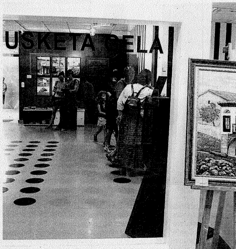
Interior de la Oficina de Turismo en Deba.

Entre las iniciativas puestas en marcha en materia de turismo cabe destacar que en 2013 se puso en marcha un programa para conocer Deba calle a calle. Se trata de una propuesta tanto para vecinos como para visitantes, que consta de siete paneles con información en euskera, castellano, francés e inglés. En la Oficina de Turismo se puede conseguir un folleto sobre esta idea, con el que también se ha querido potenciar el comercio local.