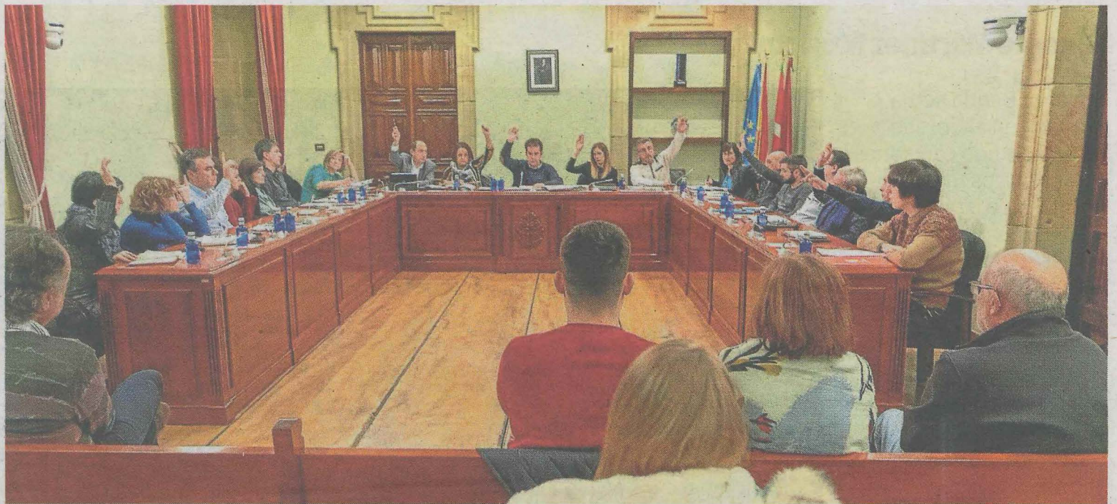
Los concejales de Ermua votan los presupuestos para el presente ejercicio.

Por otra parte, destacó la intención de estos presupuestos de impulsar políticas sociales (AES y AMIS), además de colaborar con las familias en riesgo de quiebra económica. Aclaró que estos presupuestos continúan con la intención de cumplir con el Sello de Buen Gobierno y seguir trabajando en la línea de