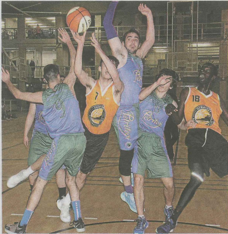
El Zalburdi ganó con facilidad al Mundarro. ANDER SALEGI

El Zalburdi, de tercera sénior, consiguió su segunda victoria en casa ante el Astigarraga Mundarro B, equipo que va tercero en la clasificación.