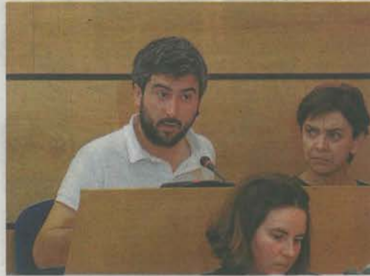
El PNV se posiciona sobre el siniestro del vertedero.