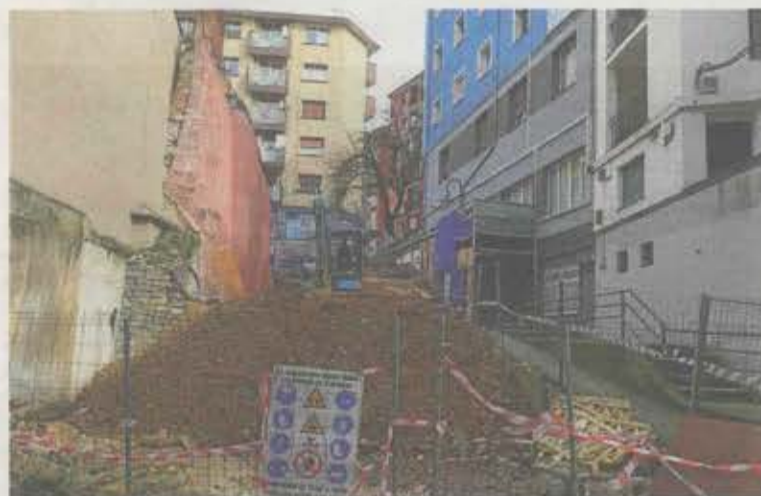
Amarbe S.L. ha retomado esta misma semana las obras. A. LASUEN

Esta misma semana la empresa Amarbe S.L. ha puesto en marcha de nuevo las obras, en las que se ha establecido una planificación para determinar la conciliación de diversas actividades, puesto que en el lugar no sólo se reconstruirán tres tercios del caserío Aldapakua, sino que también se ejecutará el paso previsto desde el lateral del frontón de la plaza a Erdikokale y la urbanización del entorno.