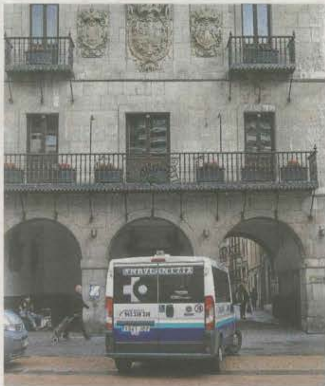
Se han tomado medidas excepcionales.