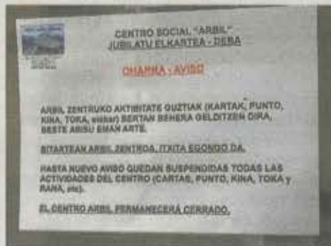
Cartel que avisa del cierre del Centro de Día.