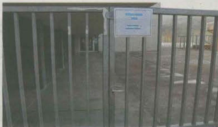
Los centros educativos también se encuentran cerrados.

En Itziar se cerrarán los siguientes lugares: Burugorri Ostatua, edificio Burugorri, Sociedad Gastronómica Usoa, Andutz Biltokia y el frontón Zabalsoro. En el barrio de Lastur también se cierra el frontón Presaola, el al-