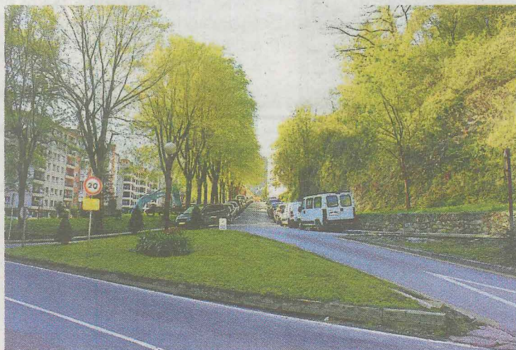
El camión de la basura accederá en dirección contraria desde aquí. A. L.

Estos cambios y el descenso en el ingreso de Udalkutxa (Diputación foral), principal aportación para los ayuntamientos, obligarán a «replantear y ajustar las cuentas municipales a la realidad», según el primer edil.