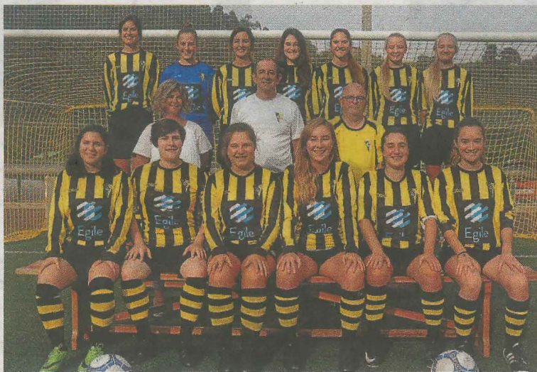
Plantilla del sénior femenino en su presentación. A. SALEGI

A su vez el infantil ha ganado el derecho de jugar la próxima temporada en categoría de honor. Con esto el Amaikak Bat po-