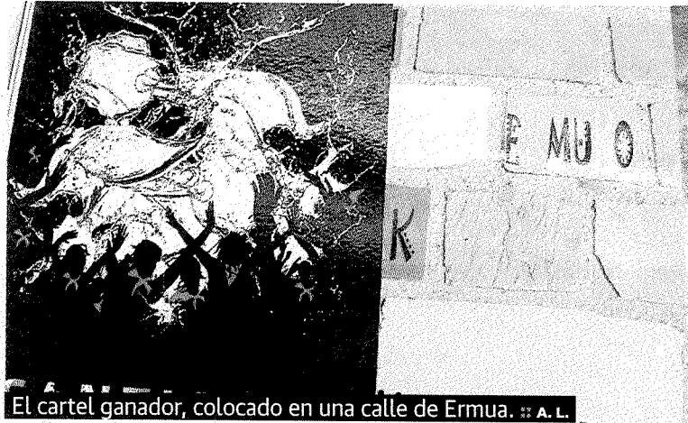
El cartel ganador, colocado en una calle de Ermua.

ñuelo rojo, a los que se lanza agua. La composición tiene un fondo negro y la leyenda de las fiestas de Ermua. El ganador de la presente edición del concurso recibirá 600 euros en metálico. Al certamen se han presentado 23 trabajos. Un jurado de profesionales de Bellas Artes ha realizado la primera selección de entre las propuestas presentadas al concurso. Finalmente, los componentes de la Comisión de Fiestas ha elegido entre dos finalistas.