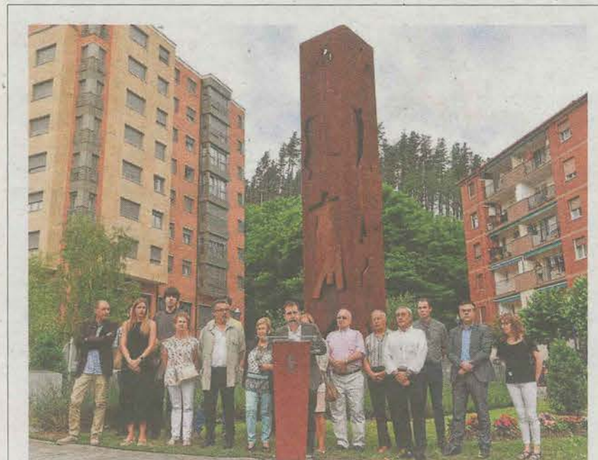
Homenaje a Miguel Ángel Blanco, ayer, en Ermua

Unas palabras que subrayó la propia Santamaría, quien explicó que fue precisamente el 13 de julio de 1997 el día en el que «asumió» un «compromiso político» con España. La noticia de la tragedia la sorprendió en el autobús que la llevaba a casa tras finalizar el primer examen de sus oposiciones: «Cuando años más tarde me propusieron trabajar junto a Mariano Rajoy me acordé de ese autobús y de la deuda que había contraído ese día», destacó.