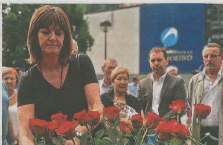
Idoia Mendia y el alcalde Juan Carlos Abascal, en el fondo.

El homenaje contó con la presencia, entre otros, de la secretaria general del PSE-EE, Idoia Mendia; de Jesús Loza, delegado del Gobierno en Euskadi; Aintzane Ezenarro, directora del Instituto de la Memoria Gogora; el exalcalde de Ermua, Carlos Totorika, así como ediles de los grupos locales del PSE-EE, PP, EH Bildu,