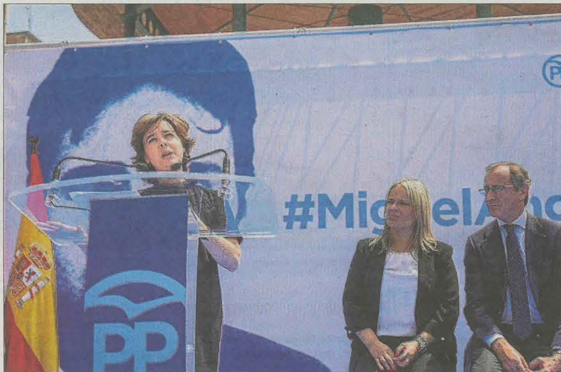
A una semana del congreso, Soraya Sáenz de Santamaría protagonizó el homenaje a Miguel Ángel Blanco.

Soraya Sáenz de Santamaría recordó que tuvo noticia de la muerte de Miguel Ángel Blanco cuando viajaba en un autobús volviendo de hacer un examen de oposición. Según aseguró ante las pocas decenas de personas congregadas en el acto de Ermua, ese día decidió asumir «un compromiso político de defensa de España».