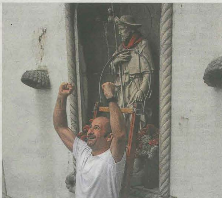
El santo con el pañuelo, una imagen muy entrañable.

Las bases del concurso son las siguientes: Toda aquella persona que así lo desee podrá participar en el concurso, pudiendo presentar un máximo de tres trabajos. Puede utilizarse cualquier técnica y material. Los carteles no deben haberse publicado anteriormente, han de ser de creación propia y totalmente originales. En caso de no cumplir este requisito, las reclamaciones que pudieran surgir correrán a cargo de quien presente los carteles. Los trabajos deberán presentarse en formato de 450 milímetros de ancho y 680