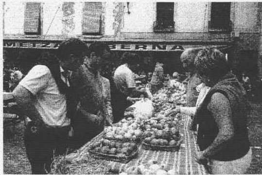
AZOKA. Arrakasta handia izan zuen azken edizioa.

Los cuatro filmes tocan temas sociales de primer orden como las