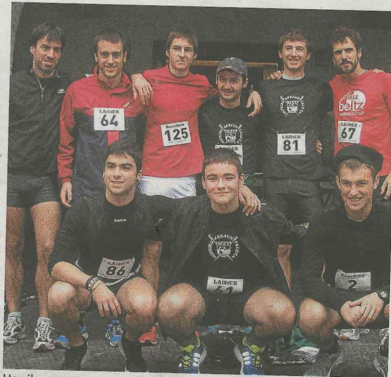
Herrikrosa entrenamendu bezala hartu zuten Arraun Taldekoekiaz.

emandakoak eta bigarrenen berriz 51, baina parte hartu nahi duten guztiak izango dute aukera baldin eta arratsaldeko 4:30etarako Txurruka plazara hurbildu eta apuntatzen badira.