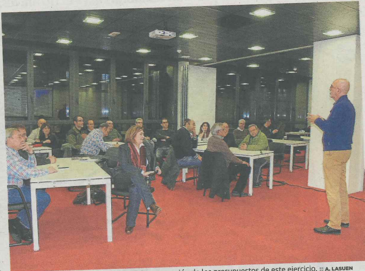
Reunión en Izarra del pasado año para la preparación de los presupuestos de este ejercicio.

Los canales de participación son numerosos, de forma que cualquier persona pueda aportar sus impresiones de la manera más cómoda posible.