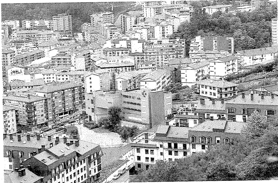
Vista del casco urbano de Ermua, donde el tráfico es la mayor fuente emisora de ruido.

Tras analizar estos datos es evidente que las zonas más afectadas son las más expuestas al tráfico viario. Estas son las que provienen de la N-634 y de la A-8, y afecta a la Avenida de Bizkaia y la Avenida de